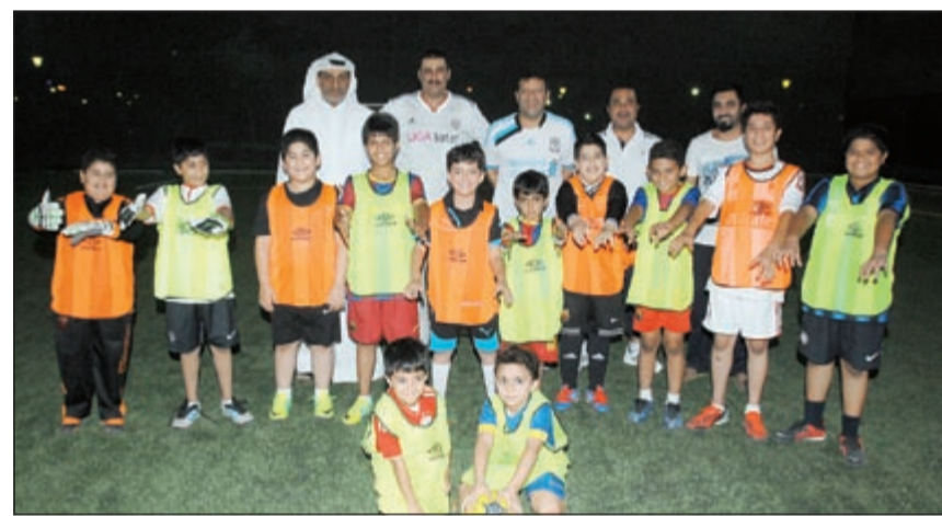
لقطة تذكارية مع بعض المشاركين في الدورة

الصغار تهتم بالجوانب النظرية والعملية لتنمية المهارات الأساسية لدى الناشئين والمساهمة في تنشئة جيل جديد من محبي رياضة كرة القدم من الفئات العمرية بين 8 و 14 سنة من خلال دورة تدريبية لمدة شهر بواقع يومين في الأسبوع على أن تكون فترة التدريب من ساعة إلى ساعة ونصف في اليوم وقيمة الاشتراك رمزية وأن إدارة الحديقة السياحية تقدم خدمة تأجير الملاعب الرياضية للمؤسسات والأفراد حيث تمتلك الحديقة السياحية ملاعب رياضية خضراء مجهزة لإقامة المسابقات والبطولات الرياضية المختلفة، وستكون هذه الملاعب جاهزة لاستقبال روادها من عشاق كرة القدم من خلال التنسيق المسبق مع إدارة الحديقة السياحية برسوم استغلال رمزية للملاعب الصغير والملاعب الكبير. ووجه امام الدعوة للراغبين في الاشتراك بالبطولة مراجعة إدارة الحديقة السياحية لتعبئة استمارات الاشتراك مصطحبين معهم صورة من البطاقة المدنية من الساعة 5 حتى 9 مساء.