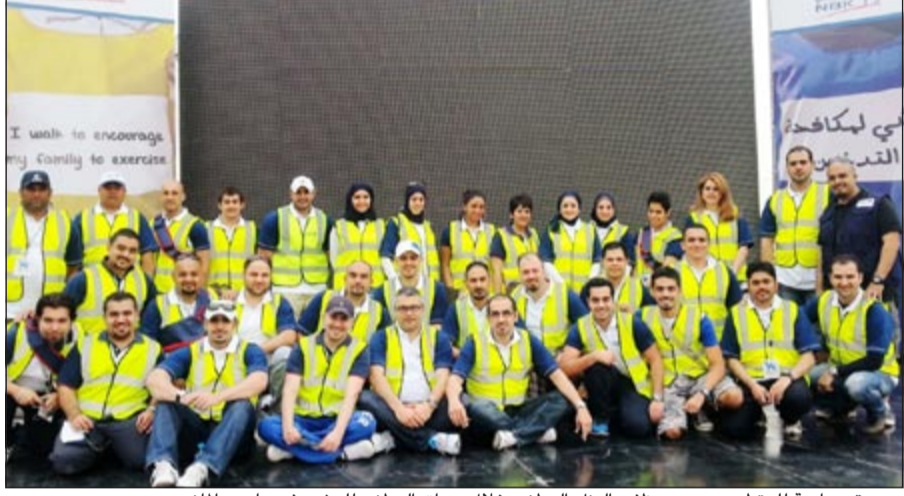
صورة جماعية للمتطوعين من موظفي البنك الوطني خلال سباق الوطني للمشي في مارس الماضي

أكد الوكيل المساعد للشؤون المالية والادارية في وزارة التجارة والصناعة جمال الشايح في تصريح لـ «الانباء» أنه قدم استقالة للوزارة أمس الأول للشابة وذلك بعد 28 عاما قضاها في القطاع الحكومي منها 25 عاما في الوزارة. وأضاف الشايح ان الخميس 27 يونيو 2013 هو آخر يوم عمل له في الوزارة. هذا، وقد عمل الشايح في بداية حياته المهنية لفترة 3 سنوات في الخطوط الجوية الكويتية ثم التحق بالعمل في وزارة التجارة والصناعة وتدرج في الوظائف من موظف بإدارة الشؤون الادارية الى رئيس قسم ثم مراقب ثم مدير