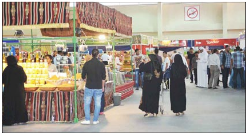
مستهلكون يتسوقون في معرض الأغذية الرمضانية

إضافة إلى وجود بعض الأدوات الخاصة بالطبخ التي تحتاج إليها المرأة لمساعدتها على إنجاز مهمتها في رمضان.