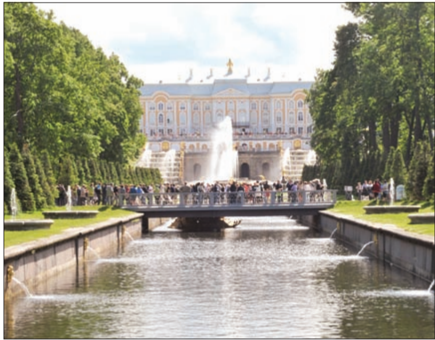
منظر لأحد الأنهار داخل حديقة قصر بيترغوف

تستغرق الجولة في عربة مخصصة لذلك 40 دقيقة كاملة - إن لم يتوقف الزائر - ليستمتع بجمال القصر والحداائق الغناء المحيطة