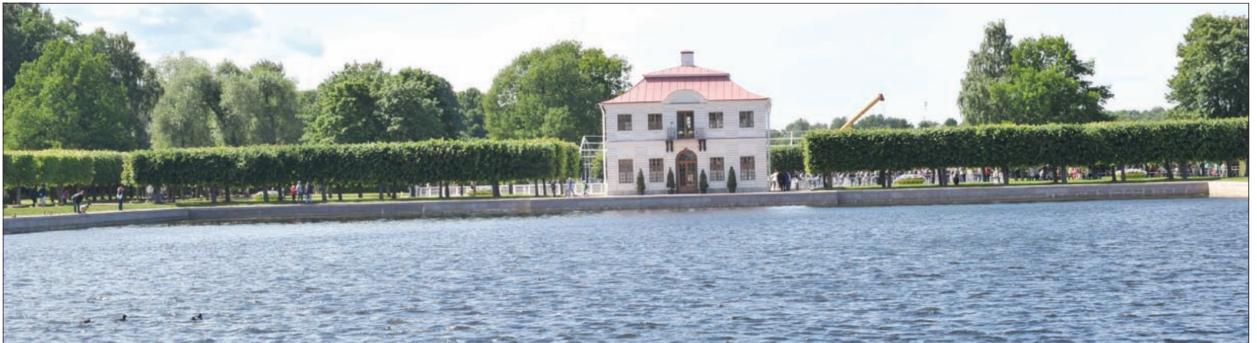
أحد المناظر الخلابة في قصر بيترغوف

ولعل أجمل نافورة من نوافير القصر العديدة نافورة حواء والتي تجسد حواء