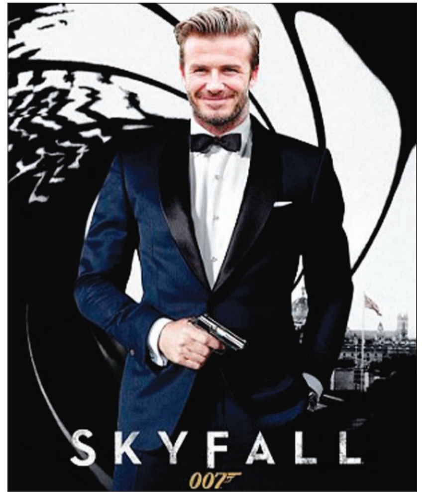
صورة تخيلية للمصق فيلم جيمس بوند الأخير ويبدو ديفيد بيكام بطلا للفيلم

قالت المغنية البريطانية فيكتور بيكام إن زوجها ديفيد سيبكون «جيمس بوند راثعا، فيما لو لعب دور العميل رقم 007، وكانت إحصائية معجبين لسلسلة أفلام العميل السري جيمس بوند قد اختارت ديفيد بيكام في المرتبة السابعة كأفضل