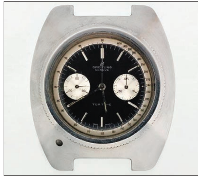
ساعة جيمس بوند التي ارتداها في فيلم «كرة الرعد»