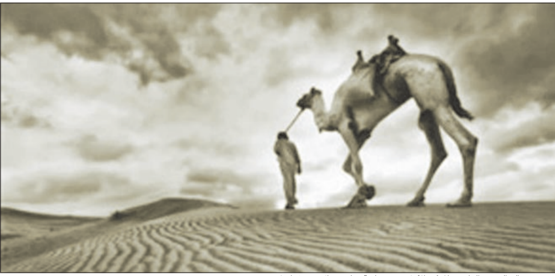
صورة خالد السبت الفائزة بالمركز الأول في مسابقة «ناشيونال جيوغرافيك»