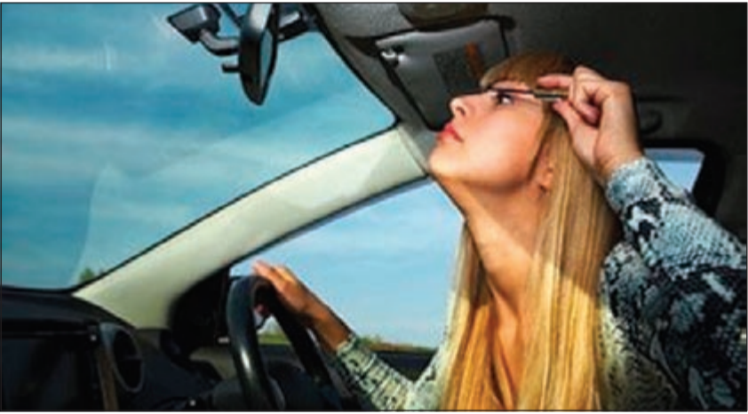
وضع المكياج يتسبب في 450 حادثا مروريا سنويا

حادث سنويا، نظرا لتشدد انتباه النساء بسبب أدوات الزينة، فإن 14٪ فقط ممن شملهن الاستطلاع اعترفن بأن وضع مساحيق التجميل داخل السيارة يؤثر على قيادتهن.