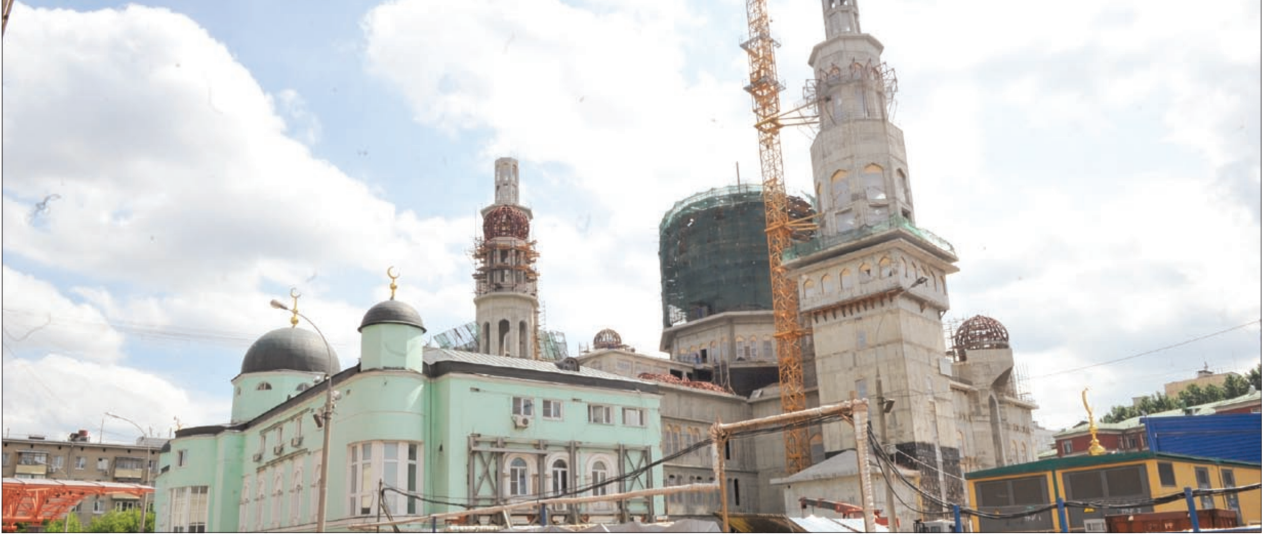
الجامع الكبير منارة للمسلمين في قلب موسكو