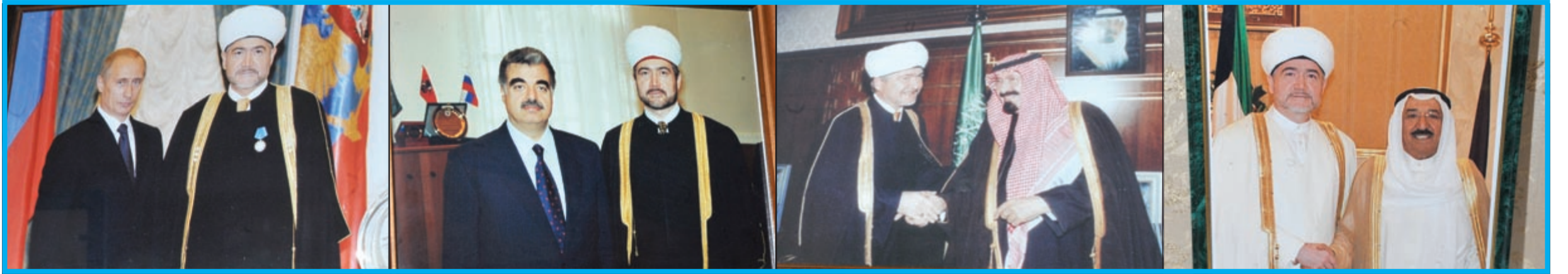
صورة للمفتي عين الدين مع صاحب السمو الأمير الشيخ صباح الأحمد.. ولقطة أخرى للمفتي عين الدين مع خادم الحرمين الشريفين الملك عبدالله بن عبدالعزيز.. ومع المرحوم بإذن الله رفيق الحريري.. ومع الرئيس الروسي فلاديمير بوتين تزيين مكتبه