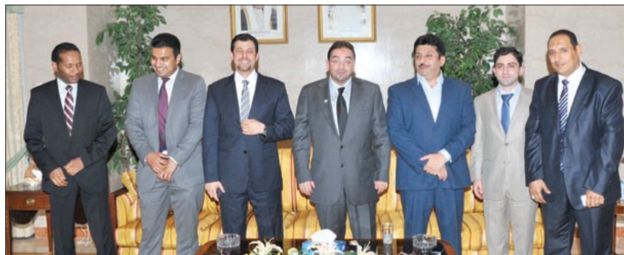
السفير الكويتي لدى روسيا الاتحادية ناصر المزين مستقبلاً وفد «الأنباء» بمقر السفارة بموسكو

أشار السفير الكويتي ناصر المزين الى ان الكويت وروسيا الاتحادية احتفلتا بالذكرى الـ 50 لإقامة العلاقات الدبلوماسية بين البلدين في شهر مارس الماضي وتم تبادل رسائل التهئة بين قيادة البلدين، واقامت السفارة حفل استقبال بهذه المناسبة حضره نائب وزير الخارجية الروسي جاليتوف واعضاء من وزارة الخارجية الروسية ومدير ادارة الشرق الأوسط وشمال أفريقيا