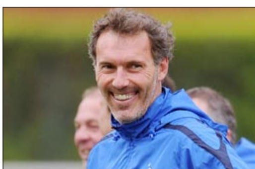
مدرب الديوك السابق بلان يتولى تدريب سان جرمان

أعلن نادي باريس سان جرمان بطل الدوري الفرنسي لكرة القدم عن تعيين لوران بلان مدربا للفريق الأول خلفا للإيطالي كارلو أنشيلوتي المتجه لريال مدريد الإسباني.