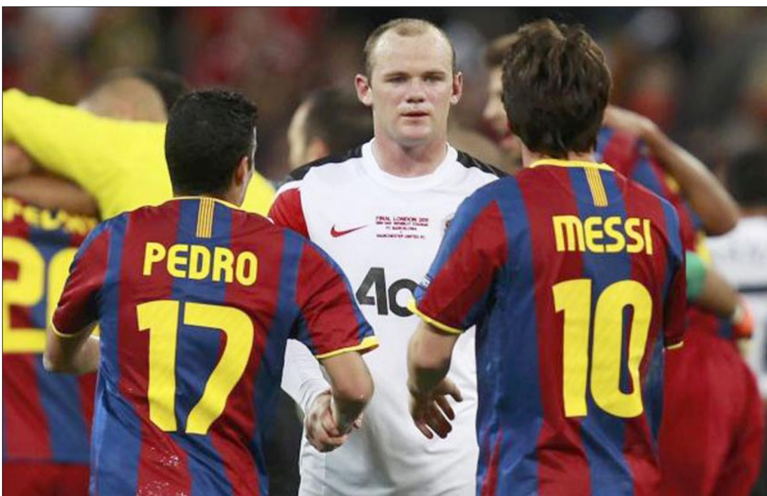
هل يلعب روني بجوار ميسي الموسم المقبل؟

ذكرت صحيفة «صن» البريطانية أن نادي برشلونة الإسباني ربما يكون مستعدا لمنافسة خصمه اللدود ريال مدريد ونادي تشيلسي من أجل الفوز بخدمات نجم مان يونايتد ومنتخب إنجلترا واين روني، ومن المقرر أن يبدأ روني محادثات جادة مع المدير الفني الجديد مان يونايتد ديفيد مويس عقب عودته أمس من العطلة الصيفية بعد أن طلب مغادرة النادي قبل نهاية الموسم الماضي حتى قبل إعلان المدير الفني التاريخي للنادي سير اليكس فيرغسون اعتزاله. ومن جانبها، أشارت صحيفة «ديلي ميل» إلى أن روني يفضل الانضمام لنادي تشلسي الإنجليزي خاصة مع تصميم المدير الفني الجديد للفريق اللندني جوزيه مورينيو على التعاقد مع اللاعب وذلك في الوقت الذي يدرس فيه كارلو أنشيلوتي المدير الفني القادم لريال مدريد الإسباني التقدم بعرض لضم اللاعب في حالة اتخاذه قرارا نهائيا بمغادرة اولد ترافورد، تجسد الأندية الثلاثة مستعدة لدفع مبلغ 30 مليون يورو بجانب راتب روني الأسبوعي الذي يبلغ 250 ألف جنيه استرليني.