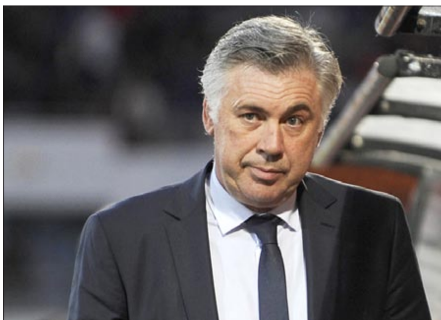
أنشيلوتي مدرب النادي الملكي الجديد ثلاثة مواسم مقبلة

مسابقة دوري أبطال أوروبا التي يلهث وراءها الفريق الملكي منذ عام 2002، وأخرى ديبلوماسية تكمن في إقناع النجم البرتغالي كريستيانو رونالدو بالبقاء في صفوف الفريق، ومن أجل تحقيق اللقب الأوروبي العاشر يتعين على أنشيلوتي المعروف ببديبلوماسيته وقربه من اللاعبين إلى تحقيق أمر واحد وهو إعادة الهدوء والطمأنينة إلى غرف الملابس بعد أن توترت العلاقات في عهد المدرب البرتغالي جوزيه مورينيو، ولا شك أن من المهمات الأساسية لأنشيلوتي إقناع رونالدو بالبقاء أقله حتى نهاية عقده عام 2015 وألا يرضخ لإغراءات باريس سان جرمان المستعد لكي يدفع له أجرا سنويا مقداره 18 مليون يورو، وأنشيلوتي المعروف ببديبلوماسيته المعهودة قادر على تلطيف الأجواء بين الطرفين خصوصا أنه عمل مع لاعبين يملكون شخصيات صعبة وأبرز دليل على ذلك السويدي زلاتان إبراهيموفيتش الذي أشاد بمدربه بقوله «لم اعمل في السابق مع مدرب مثل مورينيو في السابق وهذا امر جديد علي، تعودت على الصرامة مع المديرين السابقين أمثال مورينيو وفابيو كابيللو ما علمني الكثير، لكن طريقة أنشيلوتي أكثر لطافة وصبرا، يقوم بتوزيع المسؤوليات على اللاعبين ويمنحهم الثقة بأنفسهم وأنا احد هذه الطريقة، عندما تلعب جيدا فالفضل يعود اليه».