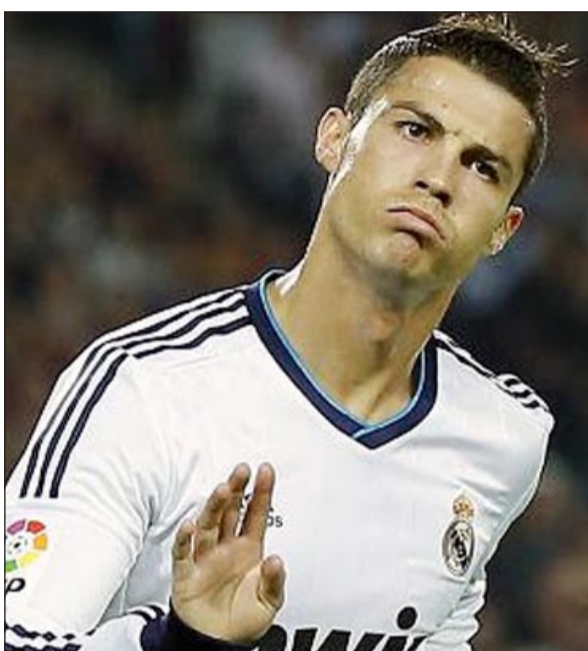
أنشيلوتي يسعى لإقناع رونالدو بالبقاء

مسابقة دوري أبطال أوروبا التي يلهث وراءها الفريق الملكي منذ عام 2002، وأخرى ديبلوماسية تكمن في إقناع النجم البرتغالي كريستيانو رونالدو بالبقاء في صفوف الفريق، ومن أجل تحقيق اللقب الأوروبي العاشر يتعين على أنشيلوتي المعروف ببديبلوماسيته وقربه من اللاعبين إلى تحقيق أمر واحد وهو إعادة الهدوء والطمأنينة إلى غرف الملابس بعد أن توترت العلاقات في عهد المدرب البرتغالي جوزيه مورينيو، ولا شك أن من المهمات الأساسية لأنشيلوتي إقناع رونالدو بالبقاء أقله حتى نهاية عقده عام 2015 وألا يرضخ لإغراءات باريس سان جرمان المستعد لكي يدفع له أجرا سنويا مقداره 18 مليون يورو، وأنشيلوتي المعروف ببديبلوماسيته المعهودة قادر على تلطيف الأجواء بين الطرفين خصوصا أنه عمل مع لاعبين يملكون شخصيات صعبة وأبرز دليل على ذلك السويدي زلاتان إبراهيموفيتش الذي أشاد بمدربه بقوله «لم اعمل في السابق مع مدرب مثل مورينيو في السابق وهذا امر جديد علي، تعودت على الصرامة مع المديرين السابقين أمثال مورينيو وفابيو كابيللو ما علمني الكثير، لكن طريقة أنشيلوتي أكثر لطافة وصبرا، يقوم بتوزيع المسؤوليات على اللاعبين ويمنحهم الثقة بأنفسهم وأنا احد هذه الطريقة، عندما تلعب جيدا فالفضل يعود اليه».