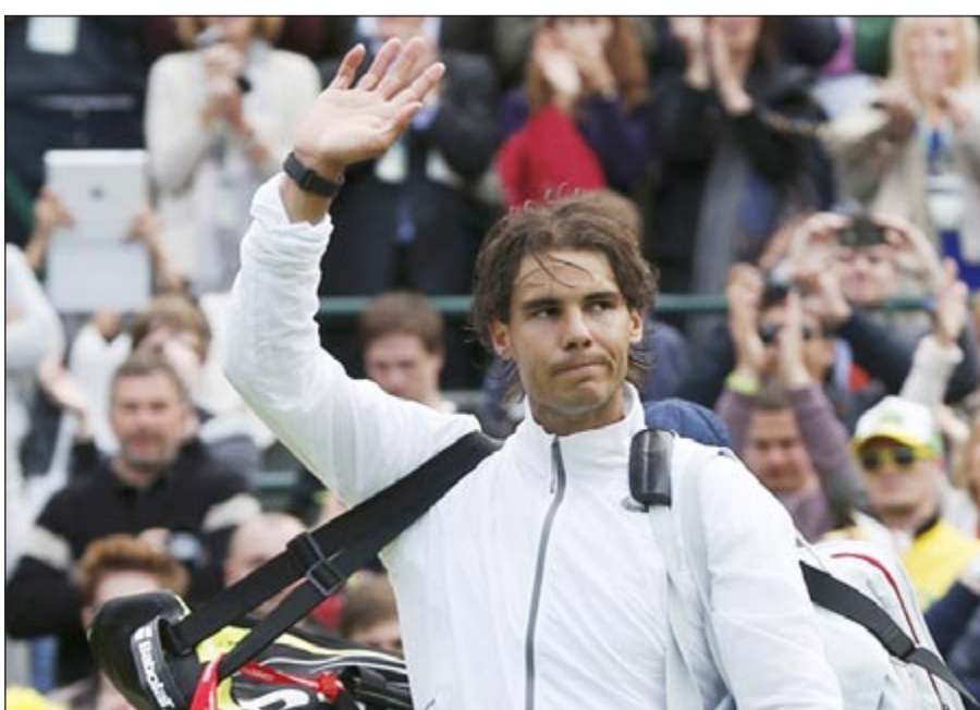
نادال يودع «ويمبلدون» بعد الخسارة المفاجئة في الدور الأول (روبرتز)

ودع الإسباني رافائيل نادال المصنف الرابع بطولة ويمبلدون الإنجليزية، ثالث البطولات الأربع الكبرى للتنس، في مفاجأة من العيار الثقيل بخسارته أمام البلجيكي ستيف دارسيس 7-6 (7-4) و7-6 (10-8) و6-4، ليخرج بطل 2008 و2010 لأول مرة في مسيرته من الدور الأول لإحدى البطولات الكبرى. والمفاجأة الثانية التي هزت المشاهدين ويمبلدون في اليوم الافتتاحي هي أن الإسباني لم يهزم قبلا في بطولات لإحدى البطولات الكبرى. والمفاجأة التصيف مثل دارسيس (135 عالميا). وكان نادال غادر البطولة نفسها العام الماضي من الدور الثاني حين سقط أمام التشيكي لوكاس روسول حيث كان يعاني من الأم في ركبته اليسرى واضطر بعدها إلى الغياب عن الملاعب 7 أشهر، وقال: لا أريد الحديث عن ركبتي في هذه الامسية. كل ما أستطيع قوله يمكن أن يفسر على أنه اعتذار وليست لدي