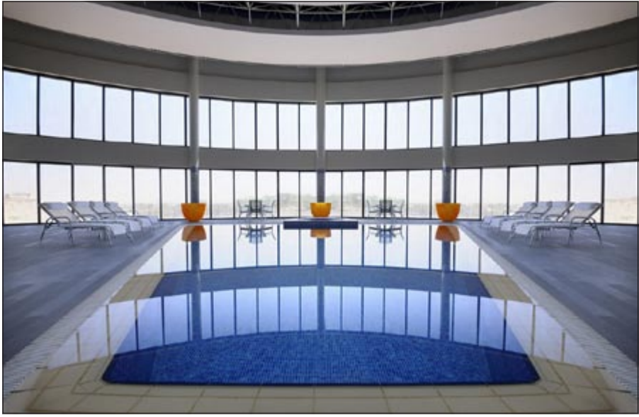
انطلاق برنامج مكافآت ماريوت عند اختيار السعودية