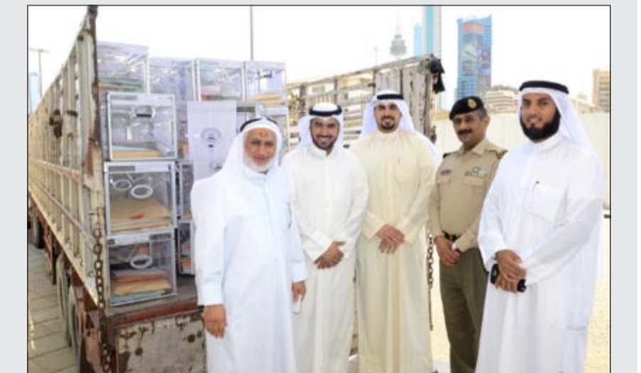
أمانة مجلس الأمة تسلم صناديق الاقتراع لممثلي وزارة الداخلية