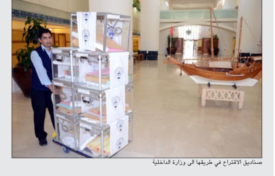
صناديق الاقتراع في طريقها إلى وزارة الداخلية

ما تكون عن ممارساتها على ارض الواقع، مشيرا إلى ان انعكاسات هذا الغرس السببي بدأت بالظهور في المجتمع من خلال ما شهدناه مؤخرا من التراشق بالاتهامات والتشكيك في الولاءات بين أبناء الأسر والقبائل فيما بينهم. ويبيّن ان هذه التيارات تسير وفق مبدأ « فرق تسد» وتسعى إلى نسف القيم التي جبل عليها أبناء الكويت من تراحم ومودة فيما بينهم، كما انها نسفت القيم الانسانية والديموقراطية التي تعزز ثقافة احترام الرأي الآخر.