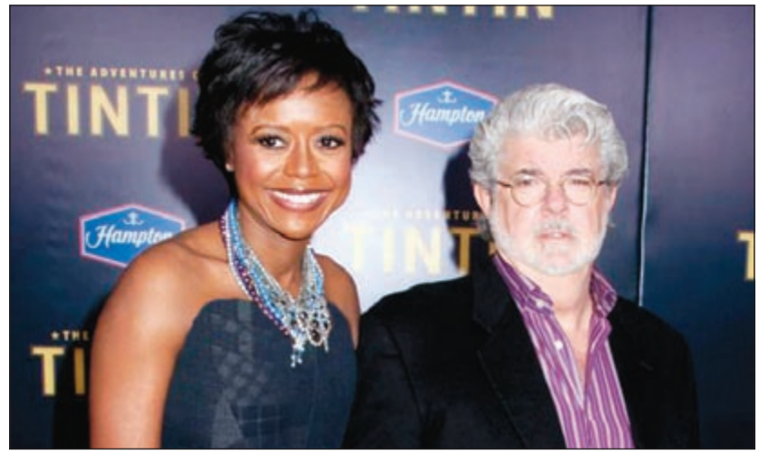
جورج لوكاس وزوجته

لوس أنجليس - (يو.بي.أي): تزوج مبتكر سلسلة أفلام حرب النجوم جورج لوكاس، من خطيبته ميلودي هويسون، خلال عطلة نهاية الأسبوع الماضي. وذكر موقع «أيس شو بين» أن لوكاس، البالغ من العمر (69 سنة)، تزوج هويسون بحفل زفاف خاص في حضور ليف من العائلة والأصدقاء.