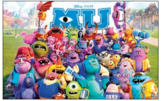
ملصق فيلم جامعة وحوش

لوس أنجليس - يو.بي.أي: انطلق فيلم جامعة وحوش الجديد بقوة واحتل مركز الصدارة الأميركية موجو، ان فيلم الرسوم المتحركة جامعة وحوش حل في المركز الأول بين الأفلام المعروضة في أميركا وجمع 82 مليون دولار. واحتل فيلم الحرب العالمية زد من بطولة براه