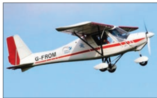
طائرة التجسس التي تستخدمها البلدة لرصد المهاجرين

سلوا، ستصدر في الأسابيع المقبلة إشعارات عقوبة بحق اصحاب العقارات التي يقيم فيها المهاجرون بصورة غير قانونية تتضمن فرض غرامة مقدارها 200 جنيه استرليني عن كل يوم يبقى فيه المهاجرون في العقارات. بعد مطالبتهم بإخلائها. وتعتبر بلدية سلوا أول سلطة محلية في بريطانيا تستخدم هذه التقنية للكشف عن وجود حرارة في المباني الملحقة لإنبات أنها مسكونة للإمساك بالمهاجرين الذين يعيشون بصورة غير قانونية فيها، وحذرت مالكي الحظائر والمرائب من أنها ستقدم على هدمها في حال اكتشاف مهاجرين غير شرعيين يقيمون فيها.