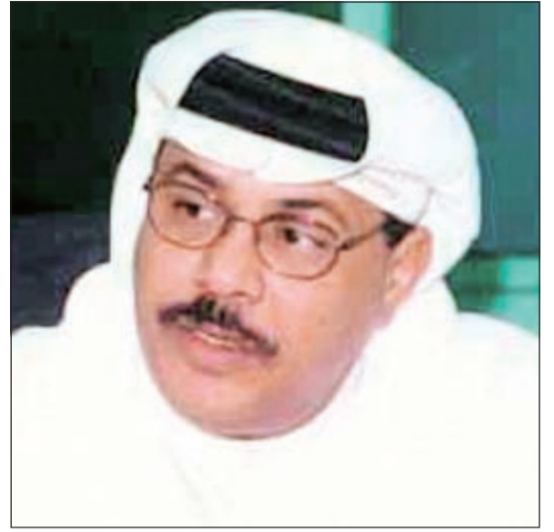
النجم القطري غانم السليطي

يستعد لتقديم مسرحية «فرجان» في عيد الفطر بمشاركة أحمد السلطان