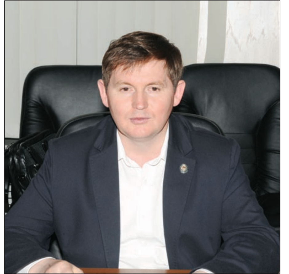
رئيس هيئة تطوير الاستثمار في جمهورية تاتارستان لينار ياكوبوف