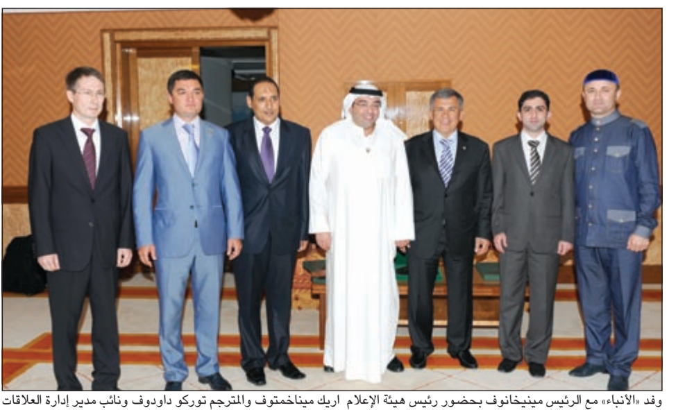
وفد «الأنباء» مع الرئيس مينخانوف بحضور رئيس هيئة الإعلام أريك مينخانوف والمترجم توركو داوودوف ونائب مدير إدارة العلاقات الخارجية بمكتب الرئيس التارستاني مراد غلاتين