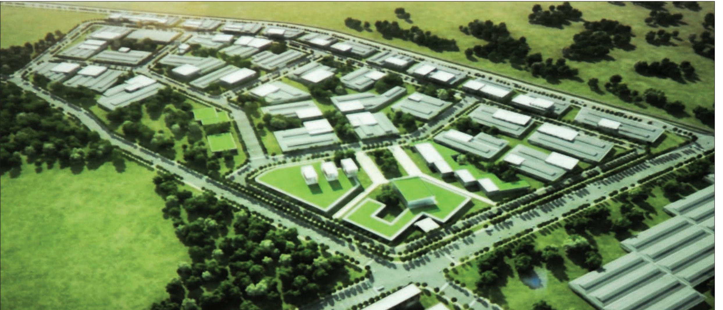
عرض لمشروع «المدينة الذكية» المطروح على المستثمرين الأجانب في تاتارستان