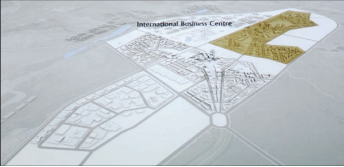
المركز التجاري المزمع إنشاؤه