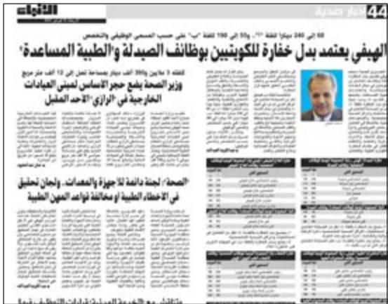
صورة زكوة جغرافية للخبر الذي انفردت «الأنباء» بنشره عن اعتماد البدلات