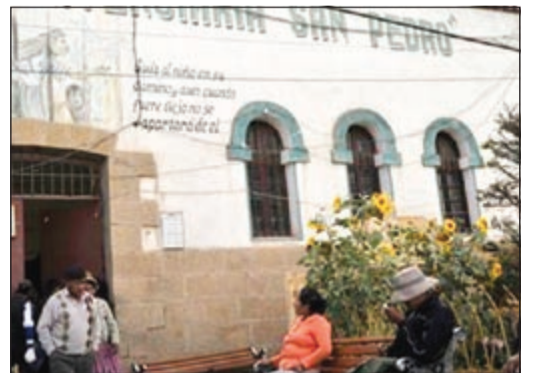
أحد سجون بوليفيا

بوليفيا - وكالات: بدأ نزلاء أكبر سجون في بوليفيا احتجاجاً على خطة حكومية تهدف لإغلاق السجن المركزي بالعاصمة لاباز، قائلين إن الأولى مساعدتهم على الاندماج في المجتمع. وقالت مصلحة السجون في بوليفيا إن خطتها بشأن إغلاق سجن «سان بيدرو» في لاباز من شأنها «وضع حد لتهريب الكوكايين وانتهاكات أخرى» يقوم بها السجناء. ويأتي قرار مصلحة السجون في أعقاب مزاعم بشأن اغتصاب أب سجين ابنته البالغة من العمر 12 عاماً عدة مرات بالإضافة إلى سجناء آخرين، لكن ناطقاً باسم السجناء نفى «حادثة الاغتصاب»، مضيفاً أن الفتاة في وضع «جيد». وأضاف الناطق «ليس ثمة دليل على أن الفتاة اغتصبت أو تعرضت لسوء معاملة أو تم لمسها»، ومضى في القول «نحن ننتظر صدور التقرير الطبي حتى نستطيع نفي هذه المزاعم». يذكر أن الفتاة التي تعيش مع أبيها في سجن سان بيدرو هي واحدة من بين بضع مئات من الأطفال الذين يعيشون مع آبائهم في السجن نظراً لحضانتهم لهم.