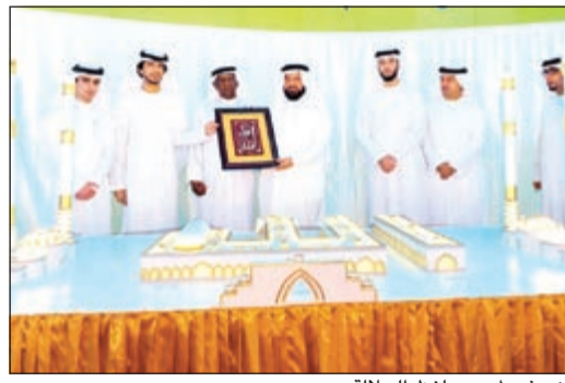
نموذج لمسجد لفظ الجلالة