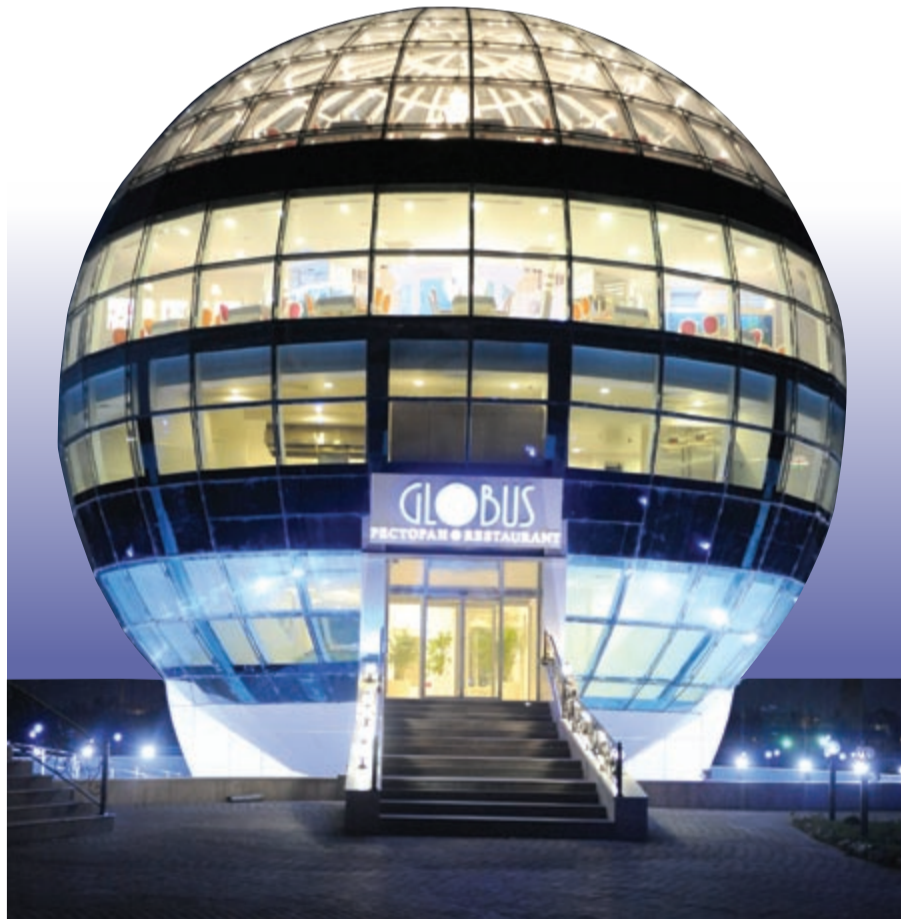
مطعم «غلوبوس» تحفة معمارية جديدة سيتم افتتاحه قريبا في قلب غروزني