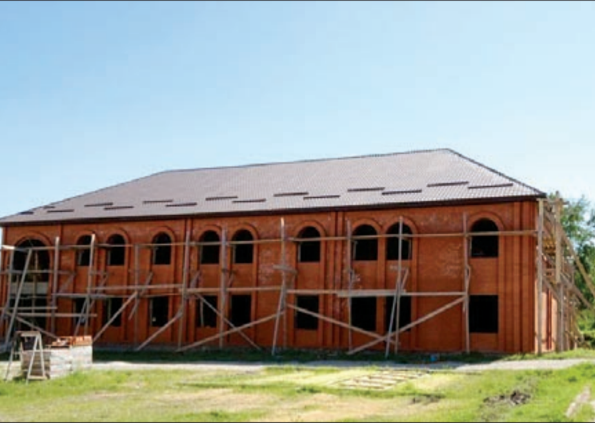
مشروع سكن الطلبة في المجمع التعليمي الاسلامي تبرعت الكويت ببنائه

في مختلف المطاعم التي زرتها كان المطبخ الاذري نسبة الى «اذريجان» هو الاكثر شهرة وبخاصة المشويات من لحوم الاغنام والعصائر التي تصنع من قطع الفاكهة الطازجة وهي