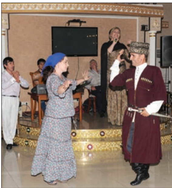
عرس شيشاني بلباس قوقازية شهبيرة

ولفت الى ان الآلاف من الطلاب يتوافدون للقبول على الجامعة سنويا يتم قبول 500 منهم فقط نظرا للإمكانات وسيتم تخريج أول دفعة من الجامعة خلال العام المقبل ويحصل الطالب عند تخرجه في الجامعة على شهادة معتمدة كدبلوم عال من