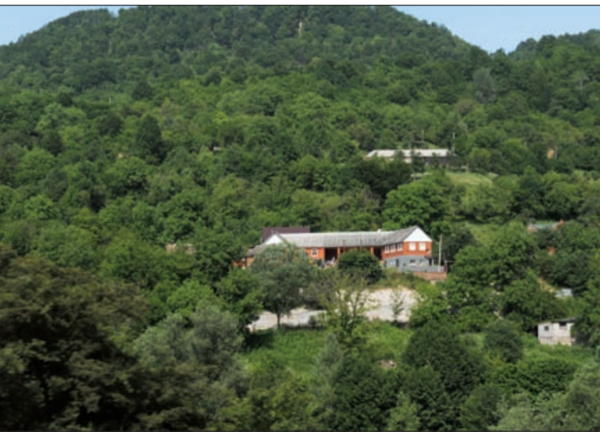
جبال الشيشان سحر الطبيعة والمناظر الخلابة

منذ عام 1990 بعد انهيار الاتحاد السوفيتي لم يتوقف الدعم الكويتي والعمل الخيري والإنساني من أهل الكويت إلى اشقائهم في الشيشان الحبيب ولعل تلك الصورة تظهر جانباً من هذا الدعم الخيري حيث تبني الكويت مشروع سكن الطلبة في المجمع التعليمي الاسلامي في عاصمة الشيشان غروزني للمرحلة الثانوية بتكلفة مليون ومائتان الف دولار تبرعت وزارة الاوقاف الكويتية منها مبلغ 167 الف دولار والأمانة العامة للأوقاف بـ 500 الف دولار.