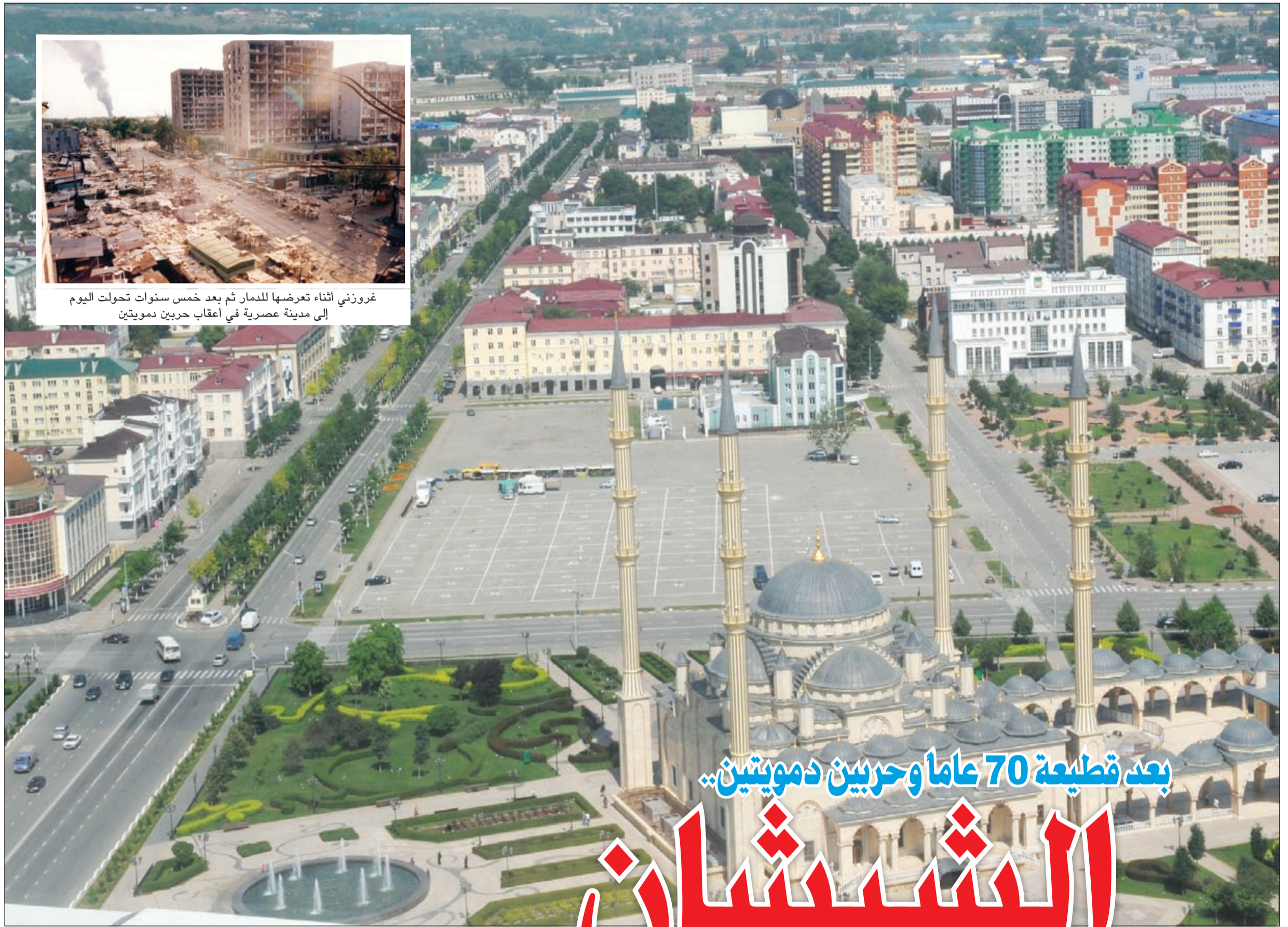
غروزني أثناء تعرضها للدمار ثم بعد خمس سنوات تحولت اليوم إلى مدينة عصرية في أعقاب حربين دمويتين