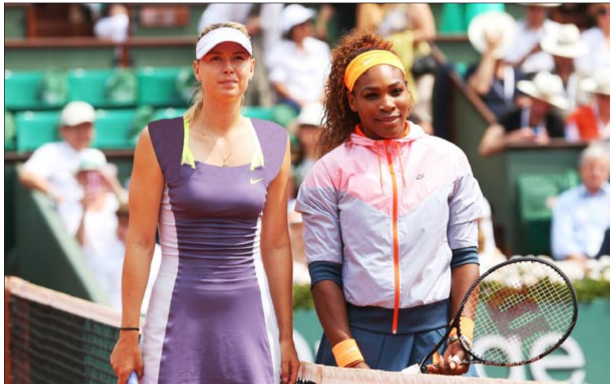
المصراع يتجدد بين سيرينا وليامز وماريا شارابوفا على لقب السيدات

أعلن الاسطورة الجامايكية أوسين بولت انسحابه من لقاء أوسترافا التشيكى للالعاب القوى المقرر في السابع والعشرين من الشهر الجاري مفضلا البقاء في بلاده لمواصلة الاستعداد للبطولات المقبلة واهمها بطولة العالم المقررة من 10 الى 18 المقبل في روسيا. وقال بولت في بيان له: «اعتذر من الذين يحبوني في أوسترافا لأنني لن اشترك فيها هذا العام» وتابع «عوضا عن ذلك، سأبقى في جامايكا مع مدربي لاسبوع آخر من التدريب قبل المجيء الى أوروبا»، وضمن بولت المشاركة في سباق 100م في بطولة العالم مسجلا 9.94م في التصنيفات الجامايكية، وعلن بلاك ايضا انسحابه في وقت سابق.