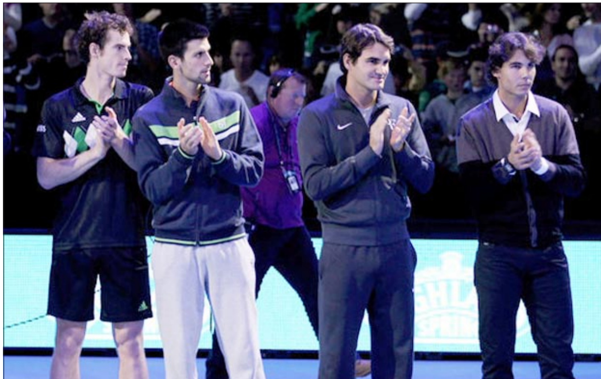
الرياضي فيدرر ونادال وديوكوفيتش وموراوي يستعدون لانطلاق مسيرتهم في ويمبلدون