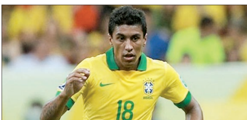
البرازيلي باولينيو بات قريباً من توتنهام