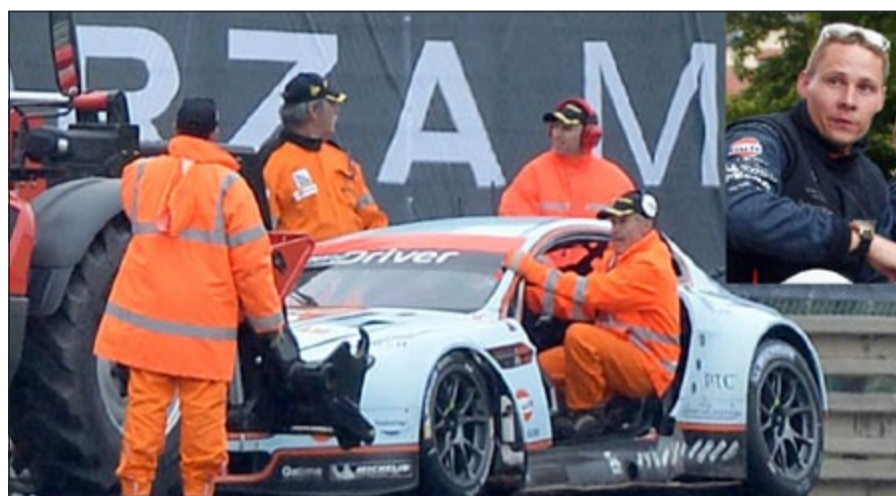
جانب من آثار الحادث خلال السباق ويبدو المتسابق الدنماركي الن سيمونسن في الاطار

توفي المتسابق الدنماركي الن سيمونسن بعد اصطدام قوي أثناء سباق اللقدرة (24 ساعة) على حلبة لومان الفرنسية اول من امس.