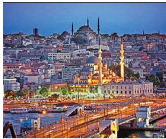
السياحة إلى تركيا متعة بلا حدود

للخروج إلى أقرب مطعم لتناول إفطارك المناسب. المفصلة: الفاصلة بالسعر أمر لا بد منه في كثير من الأماكن بتركيا، والقاعدة العامة، هي إذا كان البائع يقبل بالمقايضة على منتجته فقم بذلك وتمسك بالسعر الذي تجده مناسباً، حتى إذا وصل الأمر بالظاهر بالسعر بعيداً ورفض المنتج، خاصة أن تلك الحيلة تجعل البائع يعطيك ما تريد بالسعر الذي حددته سلفاً، أما إذا رفض فعليك اما بالتخلي عن المنتج، أو بدفع السعر المطلوب. اللغة: عليك بتعلم بضع الكلمات التركية قبل السفر، حتى يتم تعزيز تجربتك بشكل عام، ولك أن تعلم أن الشعب التركي ودود للغاية ويحاول جاهداً مساعدة السائحين والأجانب الوافدين إلى بلادهم، حتى ان الأمر قد يصل في بعض الأحيان إلى تقديم دعوة إلى منزل الأسرة لتناول الشاي أو القهوة التركية. تحويل العملة: بالتحديد يعتبر تحويل الدولار الأميركي واليورو إلى الليرة التركية من الأمور السهلة في تركيا، حيث تقدم مكاتب الصرافة