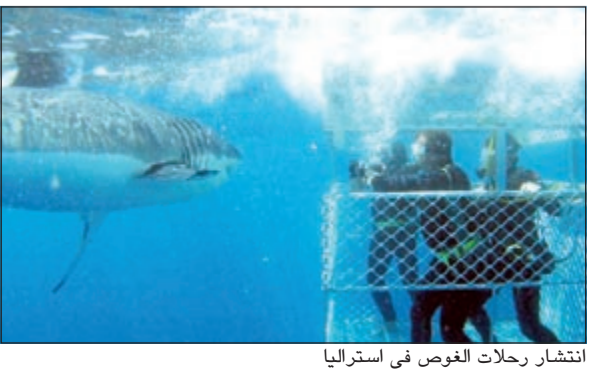
انتشار رحلات الغوص في أستراليا

الدخول إلى تركيا: يتطلب الدخول إلى تركيا الحصول على تأشيرة، ولابد أن تتأكد من أن جواز سفرك لديه صلاحية 6 أشهر من تاريخ الدخول إلى البلاد حتى لا تواجه مشكلة في المطار، ولك أن تعلم أن إقامتك في تركيا كسائح تصل إلى 3 أشهر فقط بقيمة التأشيرة حالياً 20 دولار تدفع عند الوصول للمطار لكل مواطني دول الخليج العربي. النقل من المطار: عليك بترييب عملية نقلك من المطار إلى وجهتك مع وكيل السفر الخاص بك قبل السفر إلى تركيا، خاصة أن تعريف سيارات الأجرة الموجودة أمام