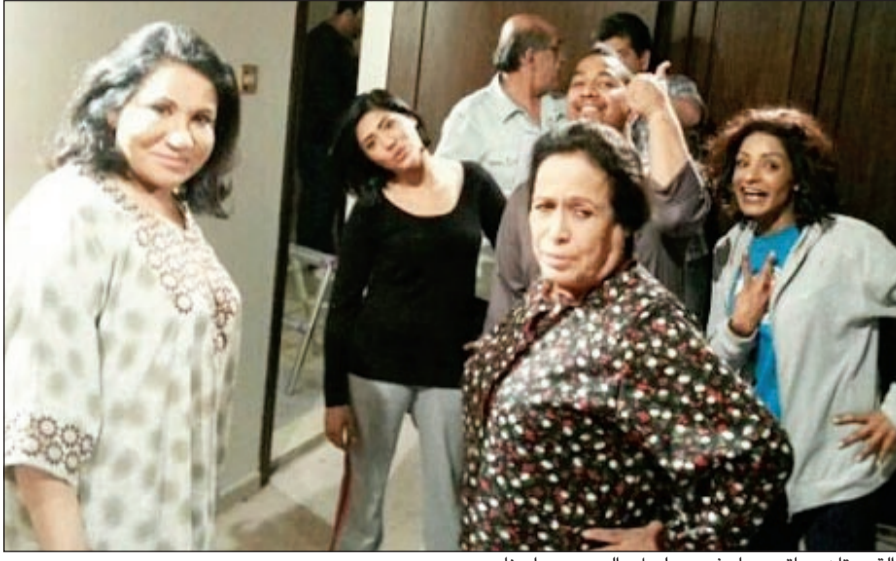
القديرتان حياة وسعاد في مسلسل «البيت بيت ابونا»