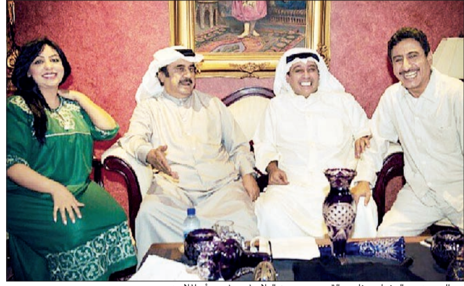
عبدالحسين عبدالرضا مع ناصر القصبي وحسن البلام في مشهد «ابوالملايين»

أو البرامج التي تتطرق لانتقاد الأعمال خصوصاً أن مثل هذه البرامج باتت في ازدياد مستمر في الشهر الكريم تزامناً مع ما يتم عرضه من أعمال لكن في هذا العام قد تختلف الرؤية لدى النجوم والمشاهدين في كيفية الانتقاد أو المتابعة لرود الأفعال فالجميع قد يلجأ لمواكبة التكنولوجيا الحديثة من خلال الهواتف الذكية والمزودة بمواقع التواصل الاجتماعي «تويتر» و«فيسبوك» و«انستغرام» وهي البرامج التي جعلت المشاهد قادراً على قول رأيه أو انتقاده بأي عمل وهو جالس في منزله دون محاولة الاتصال بالبرامج الحوارية أو متابعة الصحف اليومية فكل ما عليه هو دخول هذه المواقع و«التغريد» بأي وجهة نظر سلبية أو إيجابية من شأنها رفع قيمة العمل أو التقليل منه.