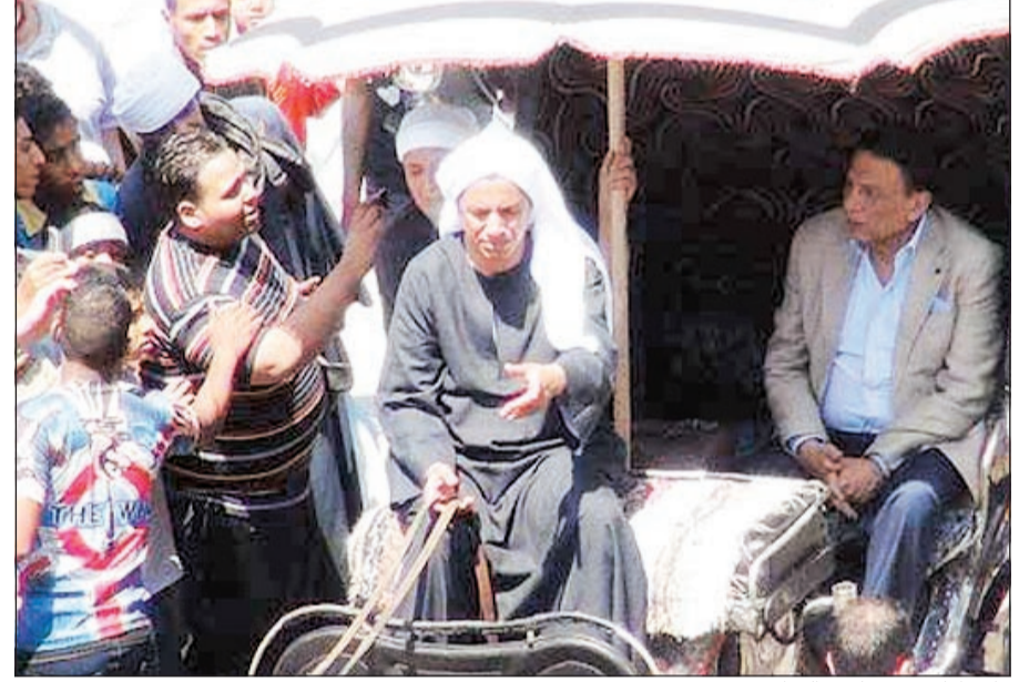
عادل إمام في مسلسل العراف

النجم الكوميدي ناصر القصبي من خلال مشاركة هي الأولى أمام عبدالعظيم عبدالرضا بعد غياب للقصبي