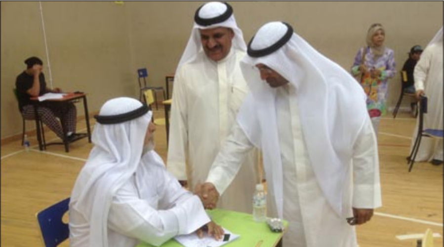
الوزير الحجرف يصافح الطالب السعيني والادوية امامه خلال الاختبار