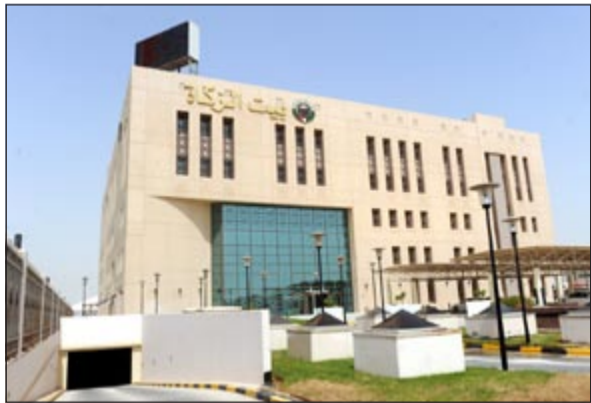
المقر الرئيسي لبيت الزكاة