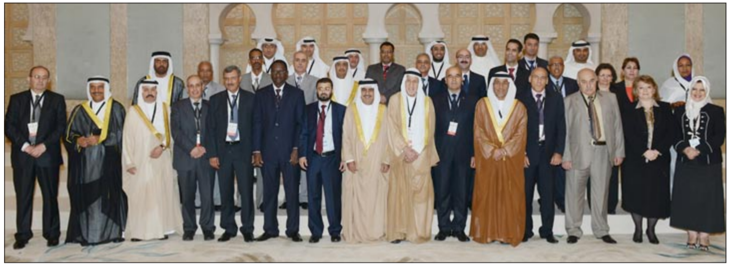
رئيس ديوان المحاسبة متوسطا اعضاء الوفود المشاركة في «الأربوساي»

تشارك وزارة العدل بوفد رسمي برئاسة وزير العدل ووزير الأوقاف والشؤون الإسلامية شريده المعشري، وعضوية مجموعة من قيادي الوزارة، في حضور الاجتماع الثاني والخمسين للمكتب التنفيذي لمجلس وزراء العدل العرب، والمقرر عقده في مدينة جدة بالمملكة العربية السعودية. ويذكر ان الكويت، قد نالت عضوية المكتب التنفيذي لمجلس وزراء العدل العرب، بموجب قرار مجلس وزراء العرب الصادر بتاريخ 26 نوفمبر 2012، حيث يشاركها العضوية في المكتب التنفيذي كل من المملكة العربية السعودية وجمهورية السودان وجمهورية الصومال وجمهورية ليبيا وجمهورية العراق ودولة قطر وجمهورية مصر العربية. ومن المقرر أن يتضمن جدول اجتماع المكتب التنفيذي، مناقشة مجموعة من الموضوعات ذات الأهتمام العربي المشترك، والتي من