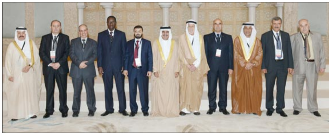
عبد العزيز العدساني متوسطا اعضاء المجلس التنفيذي

افتتح رئيس ديوان المحاسبة عبد العزيز العدساني 2013 أعمال الاجتماع الثامن والأربعين للمجلس التنفيذي للمنظمة العربية للأجهزة العليا للرقابة والمحاسبة (الأربوساي) الذي تستضيفه الكويت ويستمر يومين وذلك بحضور جميع أعضاء المجلس.