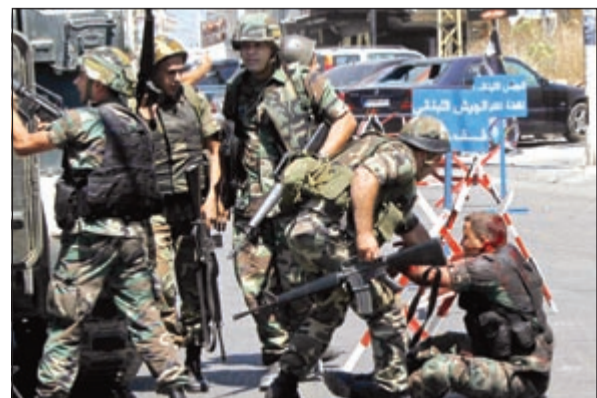
جنود لبنانيون يسعفون زميلاً لهم أصيب في الاشتباكات مع جماعة الاسير في صيدا

بيد من حديد كل من تسول له نفسه سفك دماء الجيش، وسترد على كل من يغطي هؤلاء سياسياً واعلامياً.