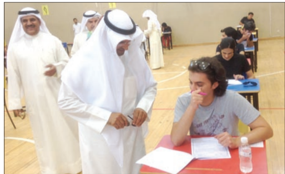
د. نايف الحجرف يستفسر من أحد الطلاب عن طبيعة الاختبار في ثانوية عيسى الحمد (هاني عبدالله)

من اي شخص كان عرقلة سير اللجان، لان هناك عقوبات رادعة لمن يخالف ذلك. وأشار د. الحجرف الي ان الاختبارات تصحب يومياً وتراجع بشكل دقيق، وهناك آلية واضحة معمول بها في الوزارة منذ سنوات تطبق بصورة واضحة، لافتاً الى ان العاملين في الكترول بشر، والخطأ وارد في