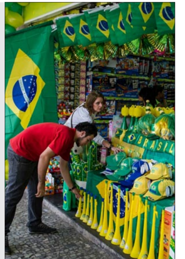
اقبال كبير على اعلام البرازيل