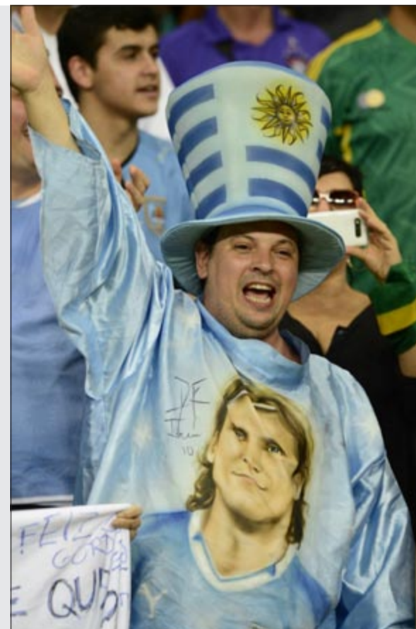
فورلان معبود الجماهير