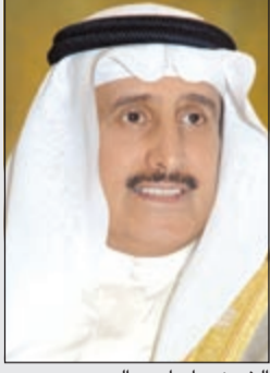
الشيخ د.إبراهيم الدعيح

القرار من تاريخ صدوره وينشر في الجريدة الرسمية.