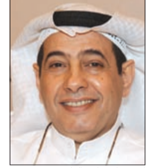
المستشار رياض الهاجري

صدر مرسوم أميري بتعيين رئيس ونائب الرئيس وأعضاء مجلس الأمناء في الهيئة العامة لمكافحة الفساد. وتضمن المرسوم ما يلي: مادة أولى