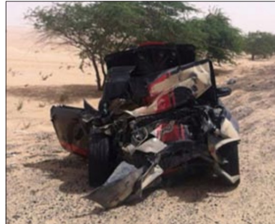
آثار الحادث على مقدمة السيارة الرياضية

قاموا باحتجاز قائد الشاحنة وهو وافد سوري وتم تسجيل قضية وأحالتهم إلى الخبر لتخطيط الحادث والوقوف على الأسباب التي تسببت بالأصطدام.