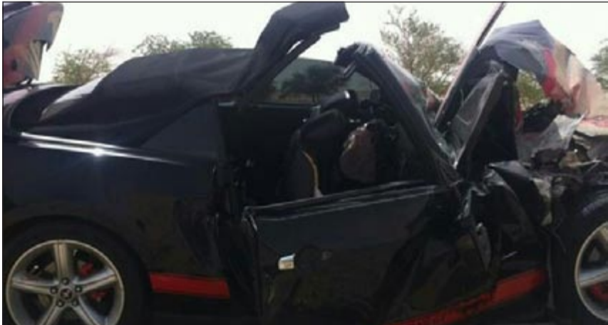
رجال الإطفاء اضطروا لقص سقف السيارة لإخراج الضحيتين