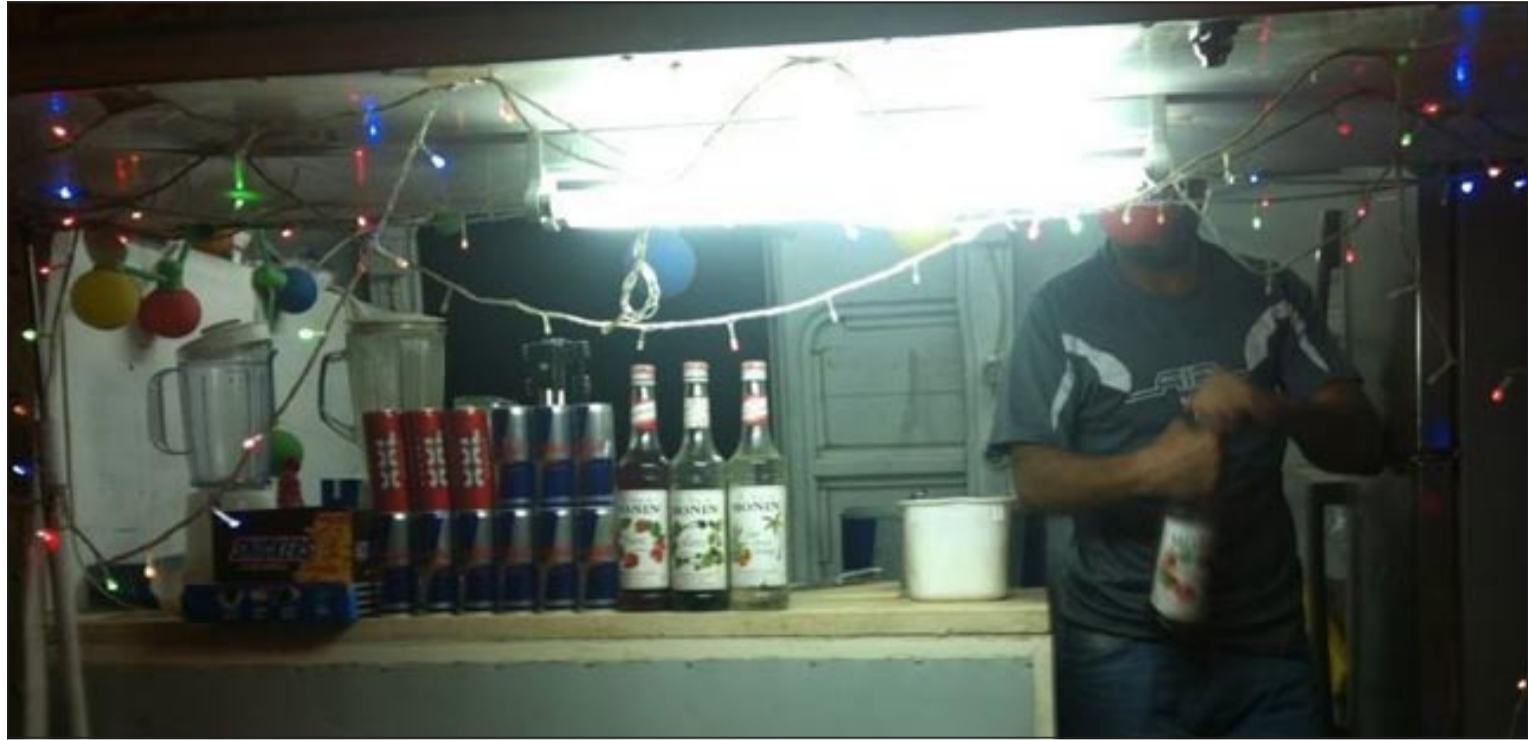
البائع الهندي يعرض لرجال الأمن كيفية خلط المشروبات الكحولية بالغازية

وتؤكد مديرية أمن محافظة الأحمدى استمرار حملاتها التفتيشية بالتنسيق مع جميع الإدارات التابعة لقطاع الأمن العام، وإدارات الوزارة ذات الصلة بهدف القضاء على جميع الظواهر السلبية، في سياق متصل، قام رجال