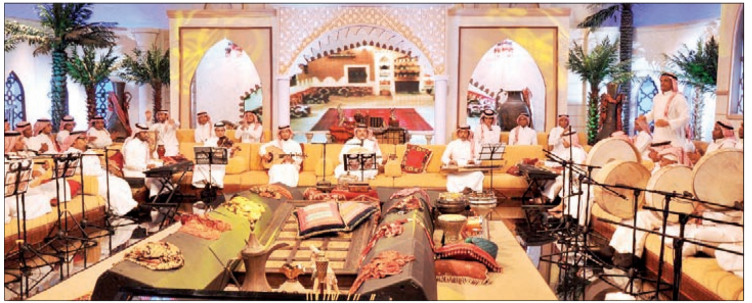
من اجواء الجلسة

مدير انتاج قاعد يدور على ممثلات يشتغلون بالعمل اللي يشرف عليه بس مو لاقى لانه اسلوب تعامله معاهم عجيب وغريب والمصيبة موراضي يعترف بهالشي.. ما عندك غير القهاري!