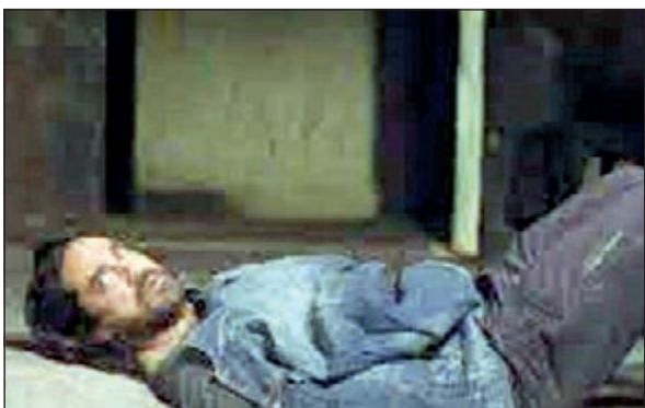
امير كركرة في المسلسل

قامت الشركة المنتجة بالاتصال بالجسدة لحماية الفنانين من التعرض لأي إصابات قد تؤثر على العمل.