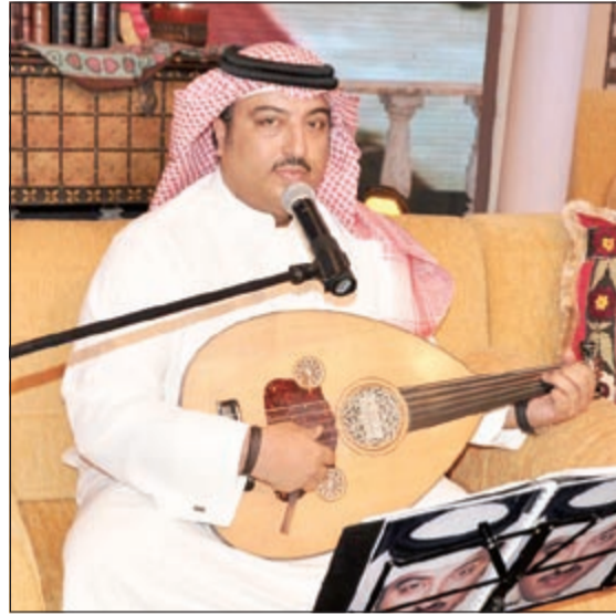
اصيل في جلسات وناسة