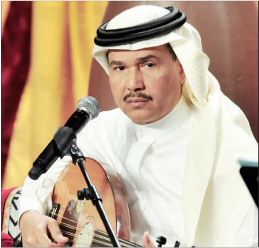
فنان العرب محمد عبده

يذكر أن آخر إصدارات محمد عبده تمثل في ألبوم غنائي عنوانه «بعلم عليها الحب»، والذي تضمن 9 أغنيات، تعاون فيها عبده مع العديد من الشعراء، مثل الراحل فائق عبدالجليل في أغنية «بعلم عليها الحب»، ومع إبراهيم فخاخي في أغنية «كلام القلب»، ويتضمن الألبوم أيضاً أغاني من تأليف شعراء شباب ومن شعراء معروفين على الساحة الأدبية وسبق له أن تعاون معهم في عدد من محطاته الفنية الطويلة والغنية.