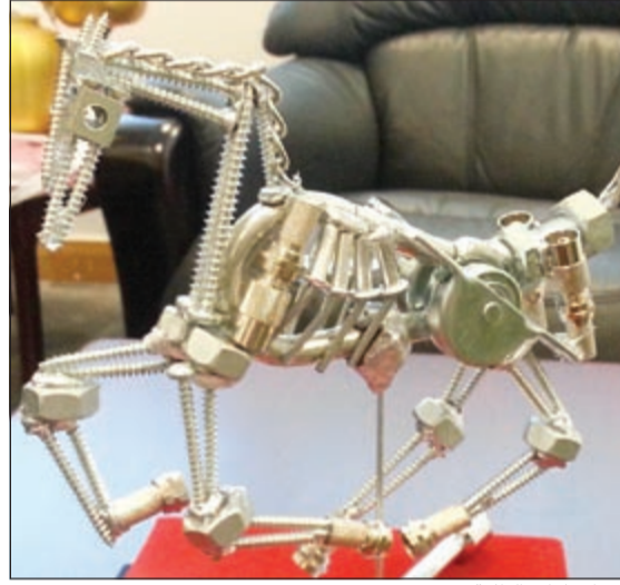
من إنجازات الطلبة