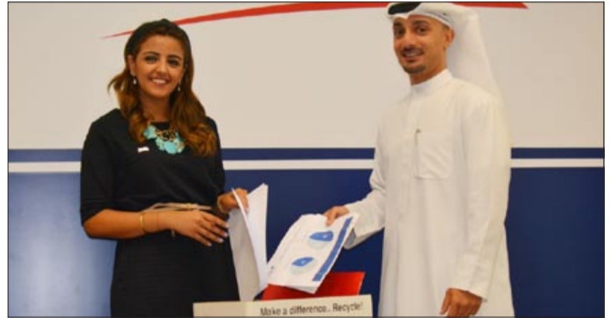
موظفو البنك الوطني يشاركون في الحملة

أطلقها بنك الكويت الوطني خلال السنوات الماضية في مجال حماية البيئة والحفاظ على الموارد البيئية الأساسية، بما في ذلك مشاركته في الحملات التوعوية لترشيد استهلاك الماء والكهرباء، إلى جانب مشاركته الفعالة في حملات تنظيف الشواطئ وإطلاقه لحملة البيئية السنوية التوعوية تحت عنوان «فكر فيها»، والتي اشتملت على العديد من الأنشطة والفعاليات التي تستهدف حماية البيئة وتحقيق التنمية المستدامة.