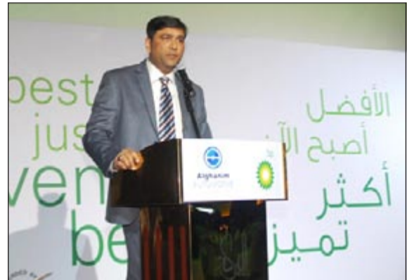
جانب من حفل اطلاق الشكل الجديد لعبوات زيوت فيسكو

وتتوافر هذه الزيوت بثلاثة أنواع هي فيسكو 2000، فيسكو 3000 وفيسكو 5000. ويشكل زيت فيسكو 2000 اختيارا ممتازا لحماية المحرك من الحرارة، حيث يشكل درعا نظيفا للمحرك، بينما يعتبر فيسكو 3000 الحل الأنسب للسيارات التي تعمل بالديزل والبنزين، حيث توفر لها نظافة وحماية عالية وطويلة في ظروف القيادة العادية ليكسبون بحق درعا حراريا يحمي المحرك. أما فيسكو 5000 فتساعد جودته العالية على حماية المحرك لفترة زمنية طويلة نسبيا مع وجود تقنية حماية المحرك من الترسبات من خلال تركيبته التخليقية بالكامل. ومع وجود هذه الزيوت تحت مظلة خدمة شركة يوسف أحمد الغانم وأولاده الوكيل الحصري لمنتجات BP في الكويت، فإن اختيار هذه المنتجات يزيد في حماية محرك السيارة ويعطيه عمرا أطول، إضافة إلى القيمة التوفيقية الحقيقية على المدى الطويل. ويمكن اختيار أي من المحلات المعتمدة لتوزيع هذه المنتجات أو في أي من مراكز من الدعامية إلى الدعامية لجعل فضل الصيف أكثر برودة على سيارتك.