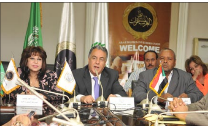
جانب من اتفاقية الشراكة الإستراتيجية بمقر مجلس الوحدة الاقتصادية

التعدين في التنقيب عن الذهب ومشروعات الأسمتت والرخام والسيراميك، وكذلك التعاون في مجال البناء والتشييد والعقارات كما تقدم الاتحاد بمقترح عدد من المشروعات مثل زراعة السمسم على مساحة 5 آلاف فدان ومشروع من جانبه، قال والي الولاية الشمالية د.ابراهيم خسر إنه سيتم منح الارض بالمجان لدعم المرأة العربية المستفزة اقتصاديا واجتماعيا والعمل على تسهيل إجراءات الاستثمار واستمرار عمل الاتفاق لمدة عشر سنوات وتجدد تلقائيا، مشيرا إلى ان الكويت من أكبر مستثمري الدول العربية في السودان.