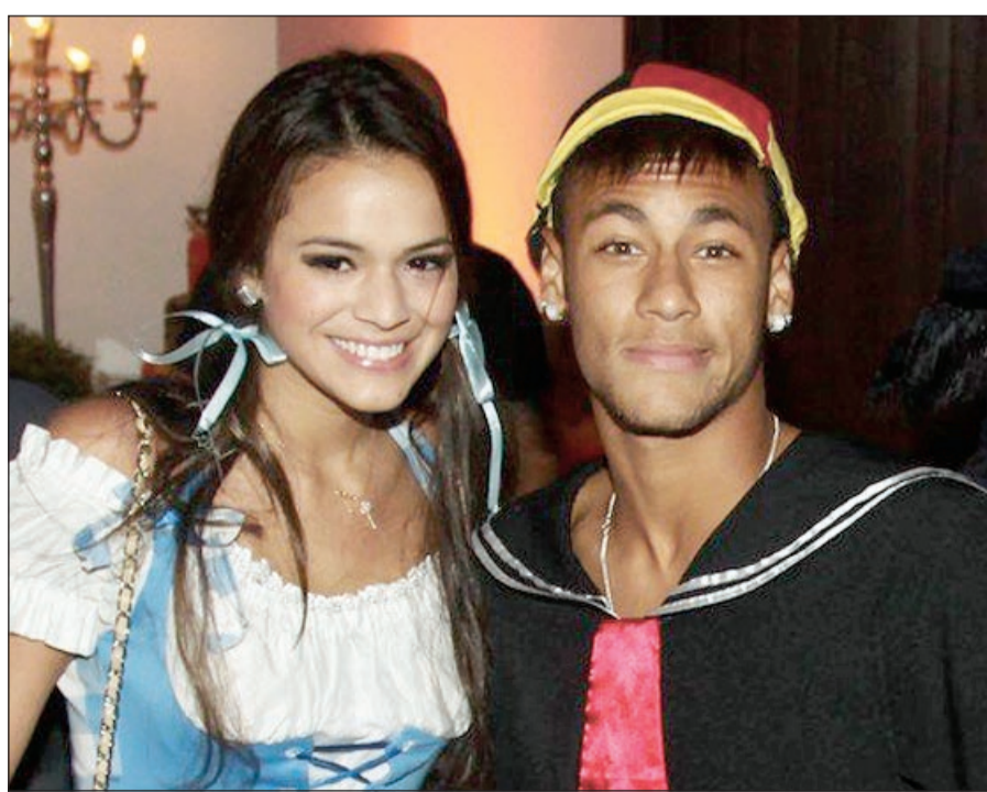
نيمار وبرونا مرشحا للقب مستر وميس يونيفرس

من الصعب تخيل فريق لكرة القدم يضم «قردا»، و«ارنيا» و«عرافا»، و«بصلة»، لكن منتخب اوروغواي، بطل الألقاب، يظهر أن ذلك ممكن. وليست هذه سوى بعض أمثلة على الألقاب التي تنطق على 23 لاعبا تضمهم قائمة بطل كوبا أميركا المشارك حاليا بالبرازيل في بطولة كأس القارات، فهناك أيضا «عصي» و«مقبض» و«جوهرة» و«بقعة»، فضلا عن «طفل» و«روسي» و«باسكي» و«مصارع ثيران». ستة منهم فقط ليس لهم أسماء شهرة معروفة، أو بمعنى أدق اسم يطلق عادة على شخص للإشارة إلى صفة جسدية مميزة أو عيب خلقي ما أو أي سبب آخر. وإطلاق أسماء الشهرة يمثل في اوروغواي عادة عامة، وأشبه بتقليد فولكلوري يتجاوز حدود كرة القدم ويظهر الإبداع الشعبي وحس الفكاهة العام، ويتعامل لاعبو اوروغواي مع الأمر بشكل طبيعي، وينادون بعضهم البعض بأسماء الشهرة «لأنها أصبحت عادة»، فهم أصدقاء أكثر منهم زملاء. ويقول لاعب الوسط ألفارو جوداليز «بابا»، الذي يلعب لنادي لاتسيو الإيطالي «إننا نعرف بعضنا البعض منذ فترة طويلة». من كانوا لا يلعبون معا كانوا يتواجبون فيما بينهم