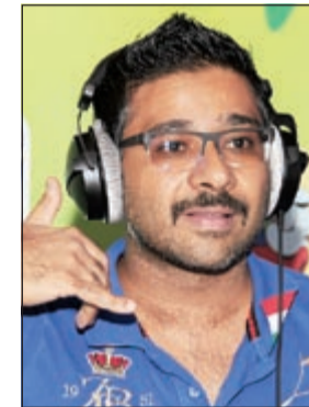
مايك ينتظر اتصالا

«حكروكم» وطلب جمهورهم ادعية ومعونات لكي ينفذوا بجلدهم من اليابانيين ومدربهم الماكر الايطالي البرتو زاكيروني. وشرشح الدوسري