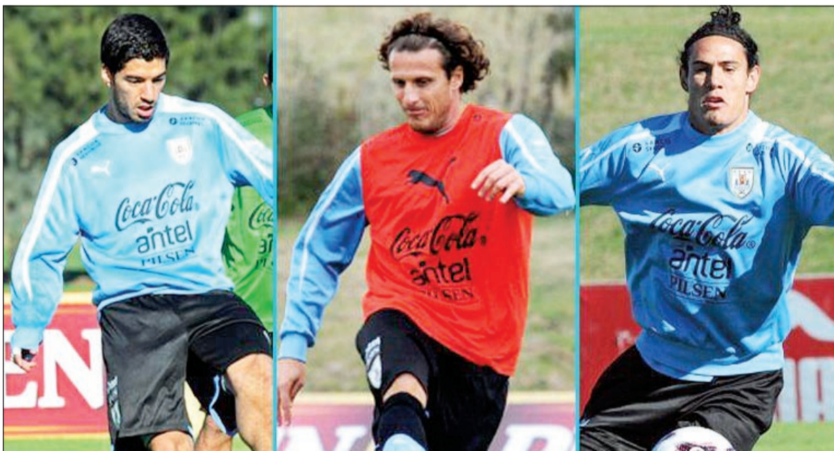
مصارع الثيران وكاتشافانشا والارنب.. او كافاني وفورلان وسواريز