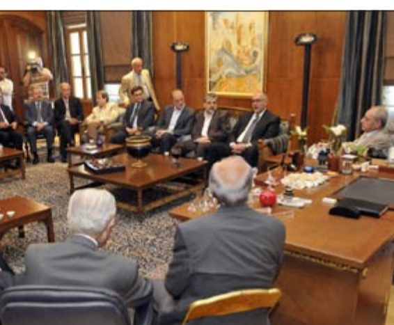
رئيس البرلمان نبيه بري في لقاء الأربعاء النيابي

هدأت في صيدا، حيث يبدو لحلفاء دمشق ان الرئيس اللبناني ميشال سليمان اسقط من حسابه كل الشيوخ والعائدين مع النظام السوري بما في ذلك سفيره في بيروت. وقرر سليمان ابلاغ الجامعة العربية بالراجحة التي سلمها إلى ممثل الامين العام للأمم المتحدة. وقالت اوساط رئاسية ان هدف خطوته هو العلم والخبر، حفاظاً على حق لبنان بأي خطوة مستقبلية.