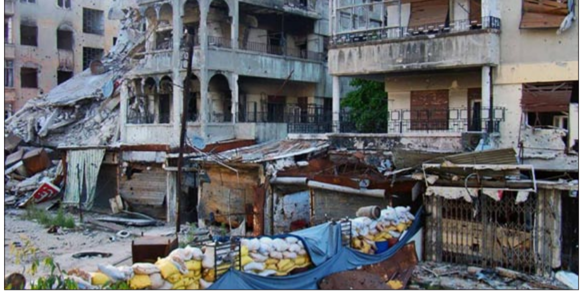
صورة نشرتها «عندسة شاب حمصي» للدمار الذي لحق بحي القصور في حمص نتيجة غارة لقوات النظام

عواصم - وكالات: ما بين الانفجار الأول من نوعه لقاعدة عسكرية لقوات النظام في اللاذقية واتهامه باستخدام غاز السارين السام في ضاحية زلماكا بريف دمشق، واصلت الحرب التي يشنها النظام السوري على معارضيه استعراها مع نبخز الأمل بعقد مؤتمر «جينيف 2» الشهر المقبل.