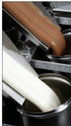
طريقة تصنيع كونكريس

ويشتهر شيك شاك بأنه مطعم للبرجر العصري وبتقديم أشهى وأجود أنواع البرجر الطبيعي كليا، الهوت دوغ الأفضل على الإطلاق والكاسترد المثلج اللذيذ. وبمعايير الجودة العالية لطعامه وبساطة مكوناته الطازجة والغنية، يعتبر شيك شاك مكاناً رائعاً ومليئاً بالمتعة، لتلاقي أفراد المجتمع على نطاق واسع. ومن خلال مكوناته المثالية والمسؤولة البيئية والتصميم، تكمن مهمة شيك