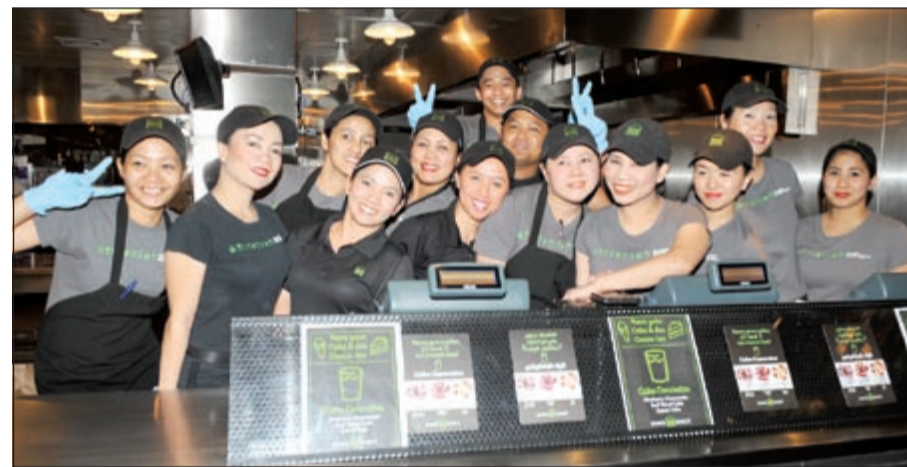
لقطة تذكارية في شيك شاك

يقدم شيك شاك، أحد المطاعم الأكثر شهرة في مدينة نيويورك، ثلاث نكهات «Cake Concrete» جديدة رائعة، جميعها محضرة من أجود المكونات الطازجة ومرتكزة على ثلاث خيارات لذينة من الكيك، لإرضاء جميع الأذواق وضمان الإحساس المنعش خلال أيام الصيف الحارة.