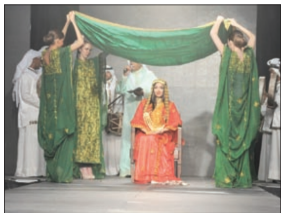
جانب من العرض