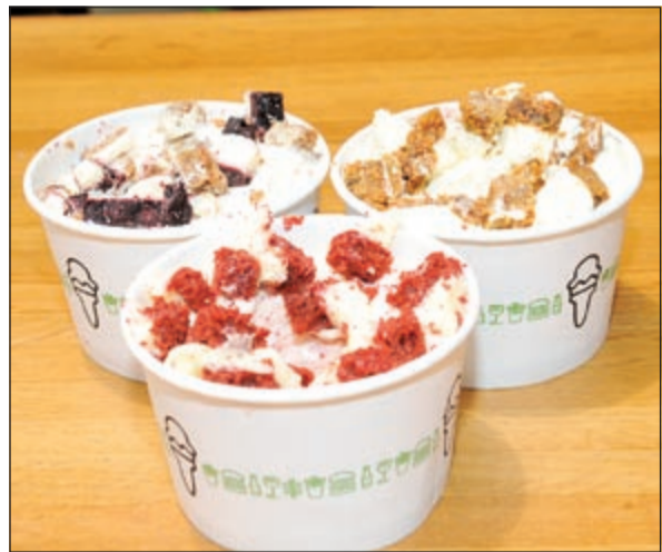
كيك كونكريس النكهات الثلاث المختلفة