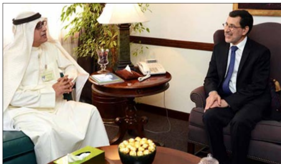
د.سعد الدين العثماني خلال لقائه مع د.سعد الدين العثماني