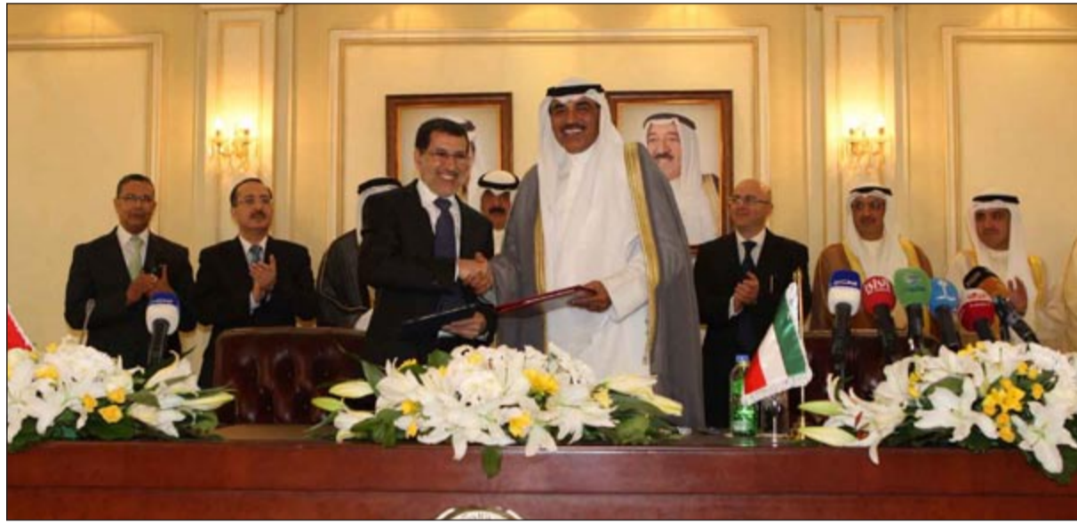
الشيخ صباح الخالد و د.سعد الدين العثماني أثناء توقيع بعض الاتفاقيات