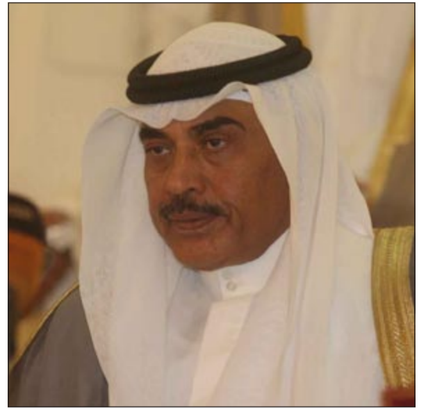
وزير الخارجية الشيخ صباح الخالد

العثماني وتم التباحث بالمسائل المتعلقة بتطوير العلاقات بين البلدين والموضوعات ذات الاهتمام المشترك. هذا وقد أجرى الوزيران محادثات موسعة وشاملة لاختلاف القضايا السياسية الراهنة والمستوى الثنائي وبشكل مفصل مجالات التعاون الاقتصادي والتجاري والاستثماري العام والخاص والمجال الجمركي والصناعي والطاقة والماء والبيئة والنقل والسياحة والتربية والتعليم العالي والاعلام والاتصال والصحة وغيرها من مجالات التعاون المشترك المتعددة، وأكد الجانبان ضرورة تواصل التنسيق والتشاور بينهما بما يضمن تحقيق المصالح المشتركة للبلدين وبما يخدم قضايا الامتثال العربية والاسلامية في ظل المتغيرات السريعة للساحة الدولية.