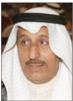
السفير خالد المغماس

تجاه القضية، قال نحن في تواصل مستمر مع الجانب الأميركي وسبق أن اجتمعنا مع الجانب الأميركي ومستمر، في التواصل الكويتي وعدم قدرتها على اتخاذ قرار واضح في قضية المعتقلين، قال ان اللجنة التي اجتمعت مع الجانب الكويتي لجنة مسؤولة عن معتقل غوانتانامو وبعضهم عن الملف وهم مسؤولون من الجانب وزارة الدفاع الاميركية، ونحن مستمرين في المطالبة بتسليم محتجزينا في غوانتانامو وندافع عن كل مواطن كويتي.