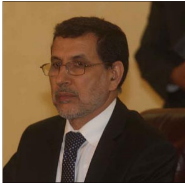
وزير الخارجية المغربي د.سعد الدين العثماني