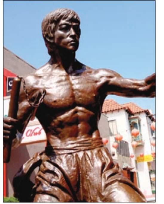
تمثال بروس لي في الحي الصيني

لوس أنجلوس - يو.بي.أي: تم تدشين تمثال برونزي للنجم الراحل والخبير في الفنون القتالية، بروس لي، في الحي الصيني بلوس أنجلوس، في التكريم الأول من نوعه له بالولايات المتحدة.