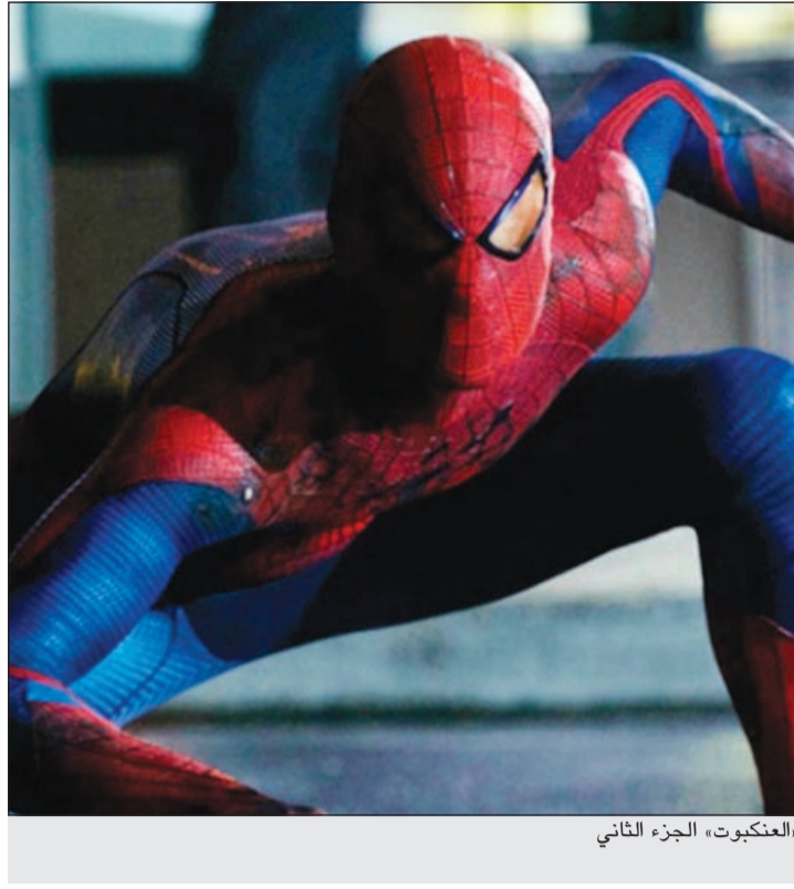
العنكبوت، الجزء الثاني

برلين - د.ب.أ: قالت الممثلة الأميركية ساندرا بولوك إنها تعتبر الرئيس باراك أوباما «خطيباً موهوباً». وأضافت نجمة هوليوود (48 عاماً): «عندما يتولى المرء منصبا كمنصبه، فلا بد أن يكون لديه موهبة إثارة الحماس في الناس بالكلمات لأن ذلك يحبب الأمل في نفوسهم». وتعرض بولوك ذات الأصول الألمانية لأحدث أفلامها الذي سيعرض في دور السينما الألمانية اعتباراً من الرابع من يوليو المقبل. ورأت بولوك أنها تفتقد مثل هذه القدرة حيث قالت: «لا أعتقد أن بإمكانني إلقاء خطاب مهم أمام أي أحد، ببساطة ليس لدي شيء أقوله وتكون له أهمية على مستوى العالم».