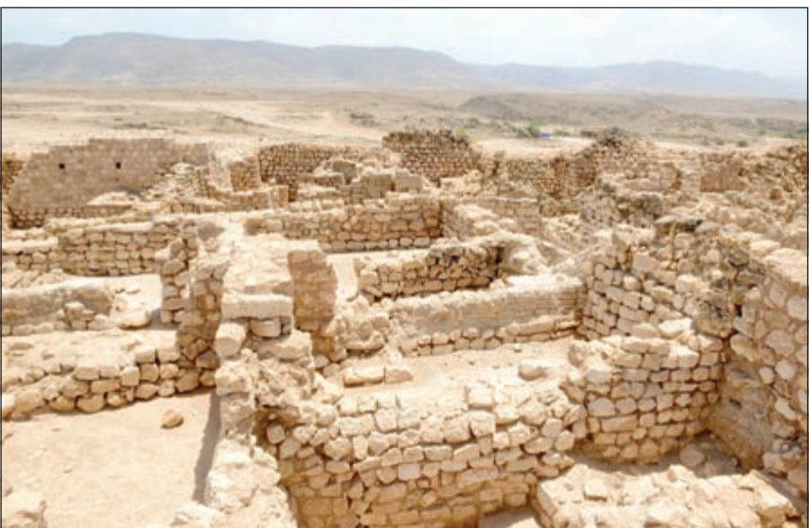
الموقع الاثري في خور روري او سمهرم