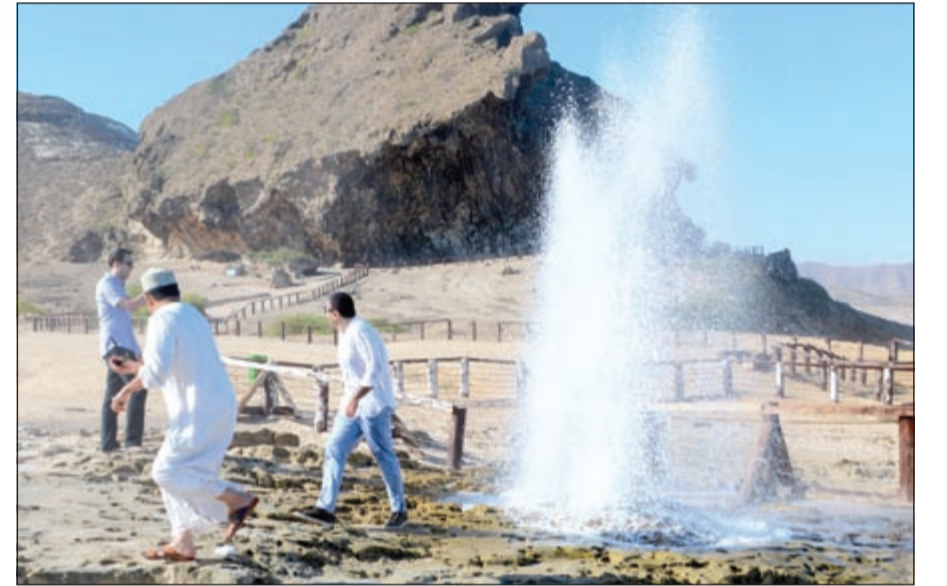
القنوب الانفجارية في مغلغل

لقد التحقت في مهمة رسمية ضمن الوفد الإعلامي الذي وصل إلى صلالة أواخر الشهر الماضي، في أول خط مباشر للخطوط الجوية القطرية رقم 127، والتي أقلعت من الدوحة مباشرة في رحلة استغرقت ما يقارب الساعتين.. حيث وجهت لي دعوة كريمة من القائمين في «القطرية» لزيارة كل من صلالة ومسقط في «مجان» كما كان يطلق عليها في التاريخ القديم أو سلطنة عمان حديثاً.. وخلال الأيام الخمسة من عمر الزيارة اطلعنا على الكثير من المشاهد التاريخية والمرافق السياحية الجميلة في السلطنة، التي باتت تنافس العديد من الدول العربية والغربية في تقدمها وحضارتها.. فبعد أيام قضيناها ما بين السواحل والجبال.. والقلاع والحصون.. والأسواق القديمة والحديثة.. اكتشفنا السر الحقيقي في