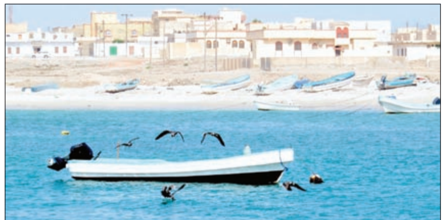
شواطئ مرياط الجميلة

وبعد رحلة داخلية إلى مسقط على متن الخطوط العمانية استغرقت ساعة وثلث الساعة، هبطنا في مطار مسقط الدولي، الذي يعتبر المطار الرئيسي في سلطنة عمان، ويقع مطار مسقط في ولاية السيب، ويبتعد المطار عن مسقط القديمة قرابة 30كم، كما يجري الان توسعة وتكبير وتحديث المطار وزيادة القدرة الاستيعابية للمسافرين، وبعد الانتهاء من اجراءات السفر في المطار، ركبنا حافلة مخصصة لفندق جراند حياة، حيث مقر اقامتنا في مسقط عاصمة سلطنة عمان، ويقع هذا الفندق ذو الـ 5 نجوم في قلب الحي التجاري والديبلوماسي في جبل عمان، ويقدم غرفا فخمة، وخدمة مطاعم، وخدمات أخرى ترفيهية ورياضية. وتعتبر مسقط مدينة قديمة في تاريخها، معاصرة في حاضرها، لعبت دورا مهما كمحطة تجارية منذ بداية العصور الإسلامية، وتعتبر من أهم المراكز التجارية نظرا لموقعها الإستراتيجي المميز المهم، وتقع فيها قلعتنا الجلال