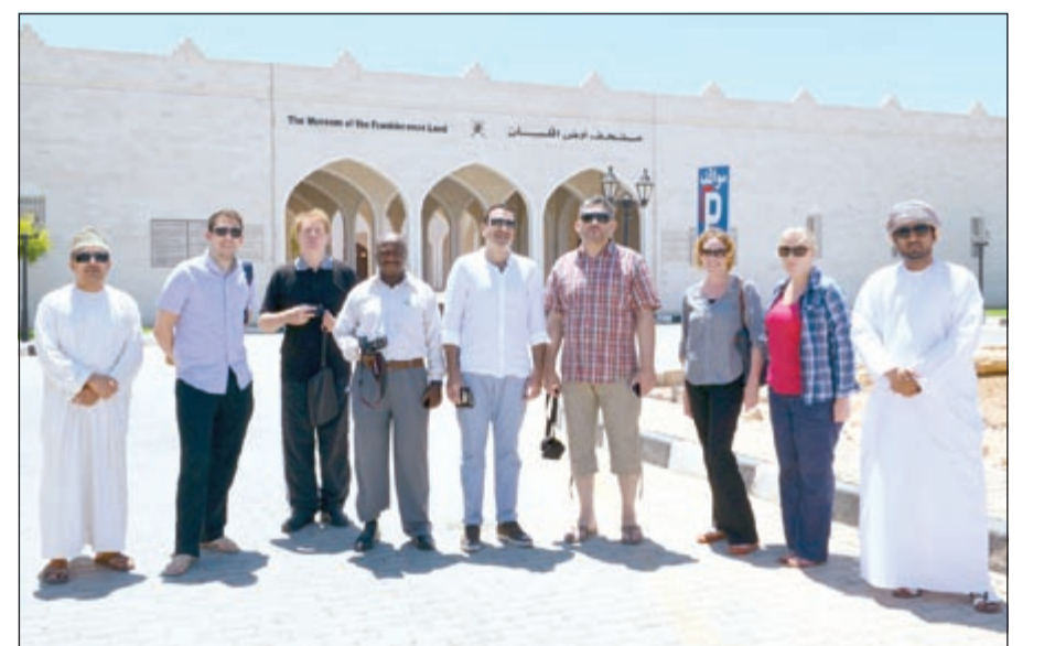
الوفد الإعلامي أمام متحف أرض اللبان في بليد

من الأمور التي اثار استغرابي خلال الرحلة حينما طلبت من الفندق الذي أقطن فيه في مسقط كوي الدشداشة فقط، وبعد الانتهاء من المهمة إذا بي أفاعاً بالمبلغ الذي دون في الفاتورة