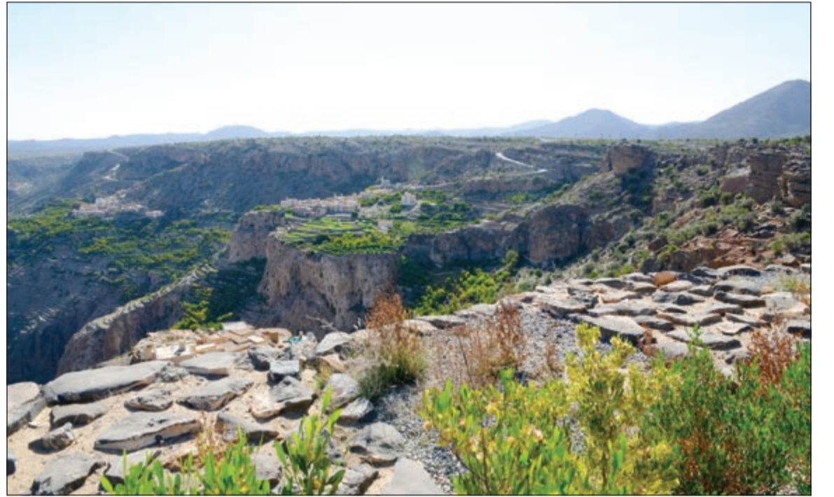
المشاهد الخلابة في الجبل الأخضر

ثم مررنا على سوق السمك في مطرح، والتي لا تختلف عن أسواق بيع السمك في دول الخليج، وأن كانت تختلف أسماء الأسماك التي تباع باختلاف أنواعها، ثم اتجهنا نحو المرسي، حيث المرسي الخاص لليخوت الخاصة للأفراد أو الشركات البحرية، وبدأت رحلتنا البحرية نحو السيف التي استغرقت 40 دقيقة، حيث تزرخ السيفة بالعديد من المناظر الطبيعية الخلابة وتتميز بشواطئها الهادئة، والجبال المحيطة تمثل وجهة سياحية جذابة لمحبي الراحة والاستجمام، وتعتبر المنطقة بما تحتويه من مفرسات جميلة إحدى الوجهات السياحية للمواطنين والمقيمين، وقامت شركة موديا السياحية بافتتاح فندق سيفاوي الذي كان لنا موعدا على الغداء مع المسؤولين عن المنتجع، حيث أكدوا ان الفندق من أول المرافق السياحية داخل مشروع جبل السيف وأول فندق يتم افتتاحه داخل المجمعات السياحية المتكاملة في عمان، حيث يشكل افتتاح فندق سيفاوي خطوة متقدمة في سلسلة مشاريع موديا السياحية في السلطنة لتعكس حضور الشركة الأساسي في عملية التطوير السياحي في السلطنة، الدوحة.. والترايزيت وبعد الاستمتاع برحلة بحرية التي كانت مسك الختام للرحلة التي نظمها «القطرية» للوفد الإعلامي، استعد الجميع لمغادرة سلطنة عمان، والتوجه إلى الدوحة في رحلة استغرقت حوالي الساعة وثلث الساعة على متن الخطوط القطرية، فكانت قاعة الترايزيت في مطار الدوحة هي المحطة الأخيرة لبعض أعضاء الوفد استعدادا للتوجه إلى بلدانهم، بعد رحلة جديدة أضيفت إلى سجل الرحلات السابقة.