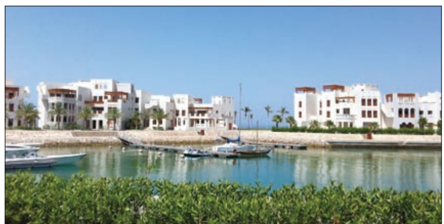
فندق سيفاوي من المشاريع السياحية في السيف