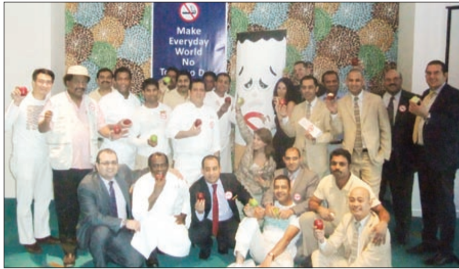
المشاركون في لحظة تنكارية

عن نفسه ويقوم بتوزيع ثمرات التفاح على الحاضرين، وشارك جميع الموظفين بوضع شارات تحمل شعار مكافحة التدخين، كما أغلقت قاعة التدخين وتحدت غرامة مالية لأي مدخن طوال اليوم. استقبل موظفو فندق «ميسوني» الحملة بسعة صدر وتفاؤل ووعود كثيرة بالبداية الجدي في الإقلاع، وقام المدير العام بتشجيعهم وتحفيزهم بالمكافآت لكل مقلع عن التدخين.