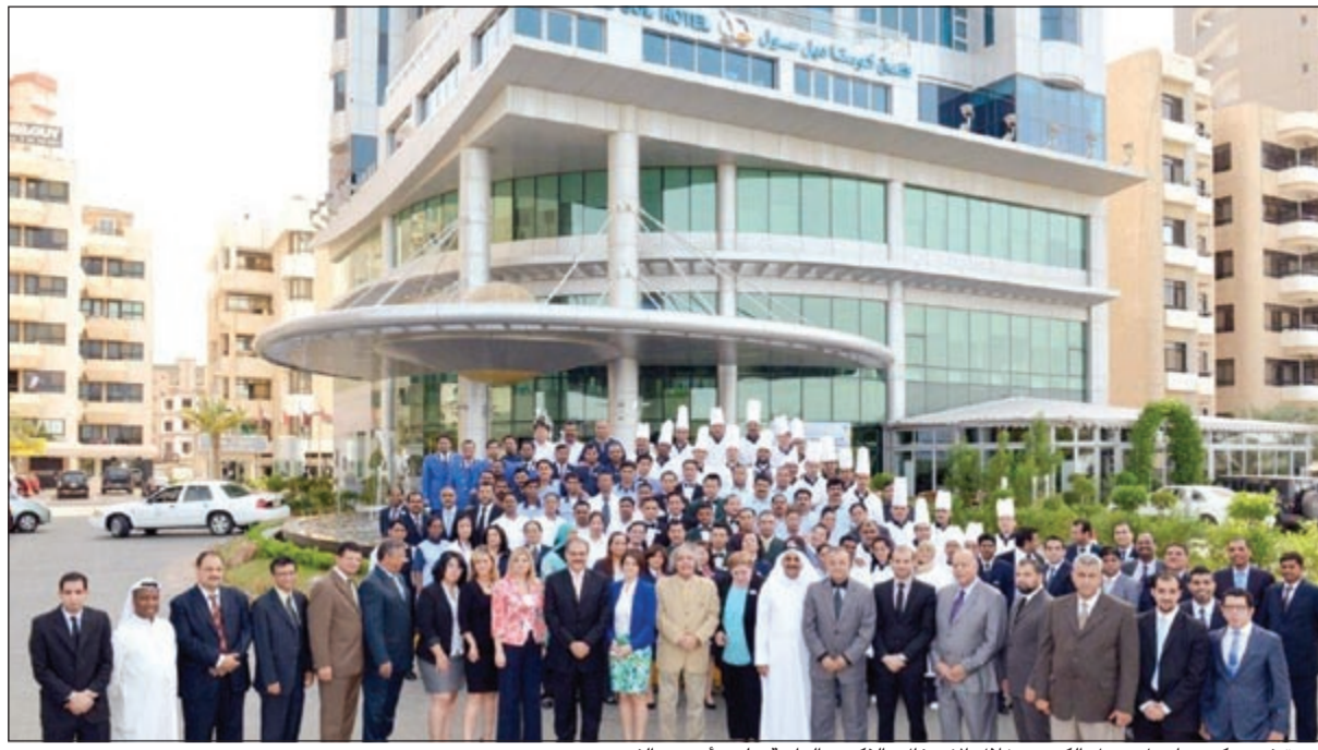
أسرة فندق كوستا ديل سول الكويت خلال الاحتفال بالذكرى الرابعة على تأسيس الفندق