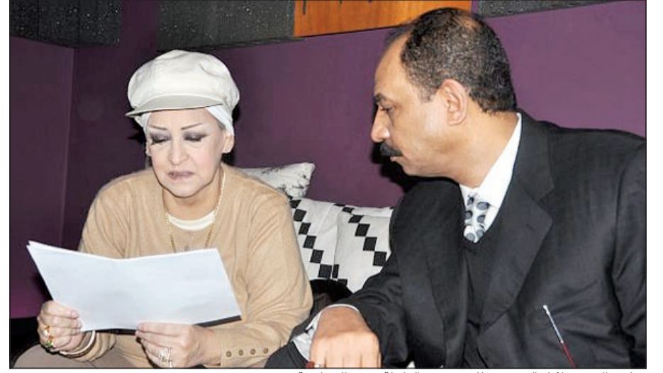
عبادي الجوهر أثناء التحضير للديتو مع الرحلة وردة الجزائرية

وانا من طبعي صريح و«اللي بقلبي على لساني ولا أحب السلف والدوران»، فمن يريدني في لجنة تحكيم يجب ان يحترم شروطي اولاً. وعن جديده، ذكر أخطبوط العود عبادي الجوهر انه يستعد لطرح اليومه الجديد في عيد الفطر المقبل والذي يتضمن الوانا جديدة ومختلفة ويتعاون فيه مع نخبة كبيرة من الشعراء والممثلين، حيث سيجمعه للمرة الاولى تعاون مع الملحن الكبير يوسف المهنا. ويتمنى ان ينال اعجاب جمهوره في الخليج والوطن العربي.