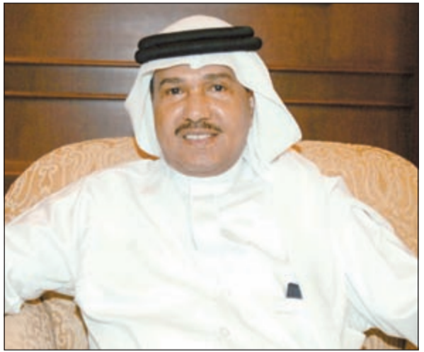
فنان العرب محمد عبده

انحصر لقب «أرب آيدول» بين المصري أحمد جمال والفلسطيني محمد عساف، والسورية فرح يوسف، وذلك بعد خروج اللبناني زياد خوري في حلقة أمس من برنامج اكتشاف المواهب «أرب آيدول». وكانت ضيفة برنامج أمس الفنانة أحلام، بالإضافة إلى دورها كعضو لجنة تحكيم مع كل من ناطي عجم، راغب علامة، وحسن الشافعي، وقد قدمت أحلام ثلاث فقرات غنائية تناولت خلالها مجموعة من أغانيها، وفي الفقرة الثانية شاركتها المتسابقون الغناء، وكان ضمنهم سلمى رشيد وبرواس حسين المتسابقان اللتان غادرتا البرنامج مع الاسبوع الماضي. وصدور راغب علامة ليشرك أحلام الغناء في الاغنية التي أهدتها له، وقدم محمد عساف مع فرح مزجا لأغنيته «بيحن» لوائيل كافوري، و«أنت ايه» لنانسي عجم، كما غنى أحمد جمال مع زياد خوري دويتو أغنية «أتحدي العالم» لصابر الرباعي، ووقفت فرح مع زياد