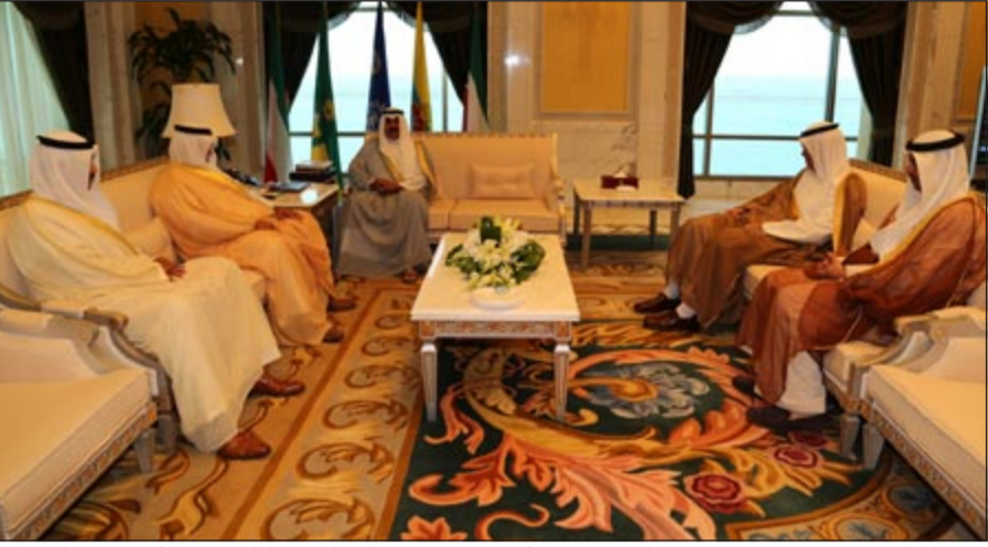
سمو ولي العهد الشيخ نواف الأحمد مستقبلاً الشيخ أحمد الخالد والشيخ صباح الخالد والشيخ سلمان الحمود والشيخ محمد العبد الله

صباح امس نائب رئيس مجلس الوزراء ووزير الدفاع الشيخ أحمد الخالد. واستقبل سموه نائب رئيس مجلس الوزراء ووزير الخارجية الشيخ صباح الخالد. كما استقبل سمو ولي العهد بقصر السيف صباح امس وزير الاعلام ووزير الدولة لشؤون الشباب الشيخ سلمان الحمود. واستقبل سمو ولي العهد وزير الدولة لشؤون مجلس الوزراء ووزير الدولة لشؤون البلدية الشيخ محمد العبدالله.