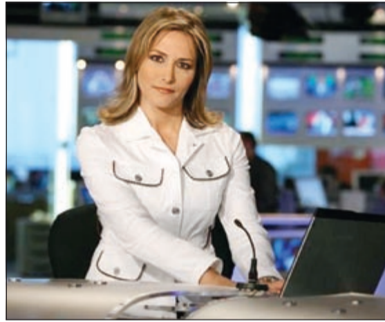
تنوري مقدمة حفل الافتتاح في البطولة