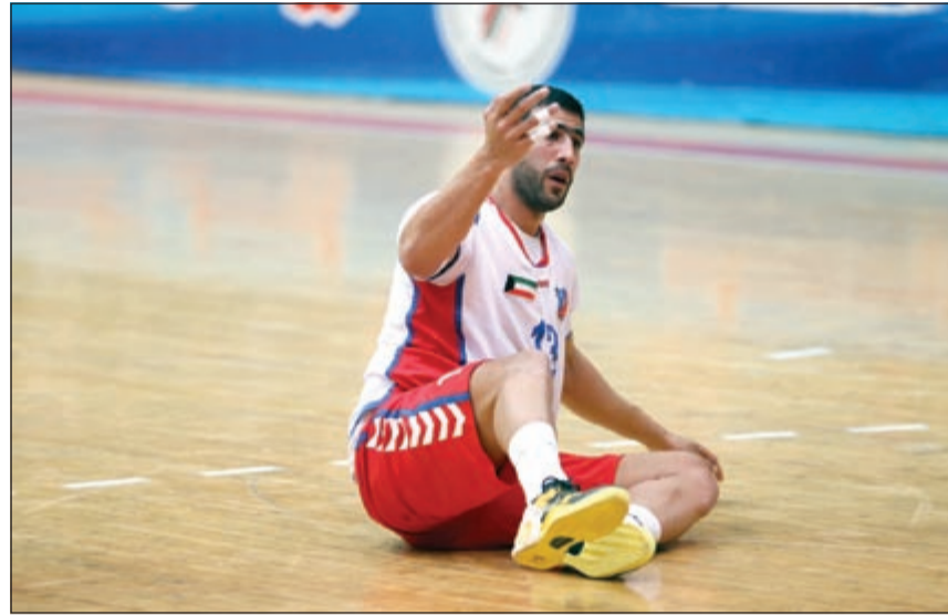
هل النظام الجديد للدوري سينهض بالمستوى الفني؟

الدوري بالمباريات التي كان طرفها الفرق الأربعة الأولى وهي الكويت والقادسية والقرين والعربي وهذا ما دفع لجنة المسابقات للبحث عن نظام جديد للدوري يضمن ارتفاع المستوى الفني وزيادة عدد المباريات القوية وذلك قررت طريقة الدوري الجديدة لتخلق نوعاً من المنافسة في أغلب المباريات في الموسم.