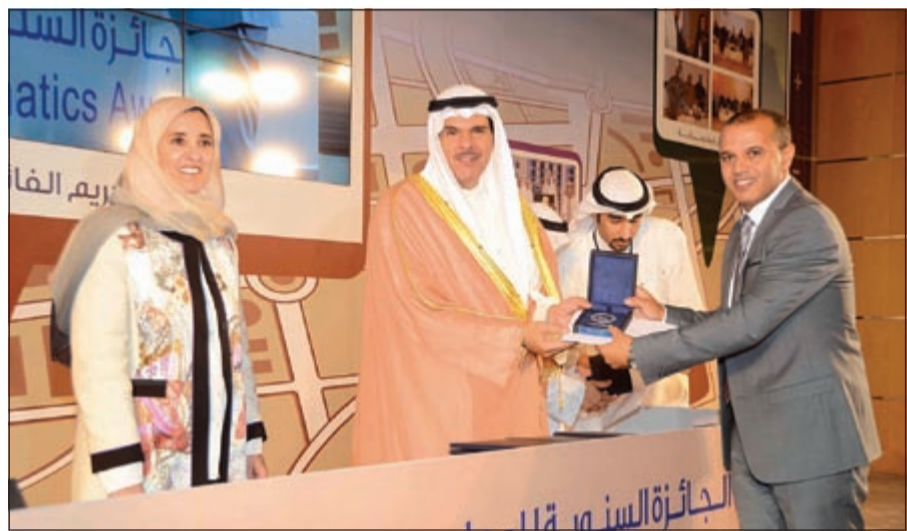
...وتكريم متطوع آخر

ولفت الحمود إلى أن وقوف سمو الشيخ سالم العلي وراءها ودعمها برؤيته وخبرته وإمكاناته من أسرار نجاح الجائزة، فهو الذي يجمع بين أصالة الأبناء الذين بنوا الكويت وبين حداثة القائد الذي يرسم لنا طريق المستقبل وبحكمة وبعد نظر.