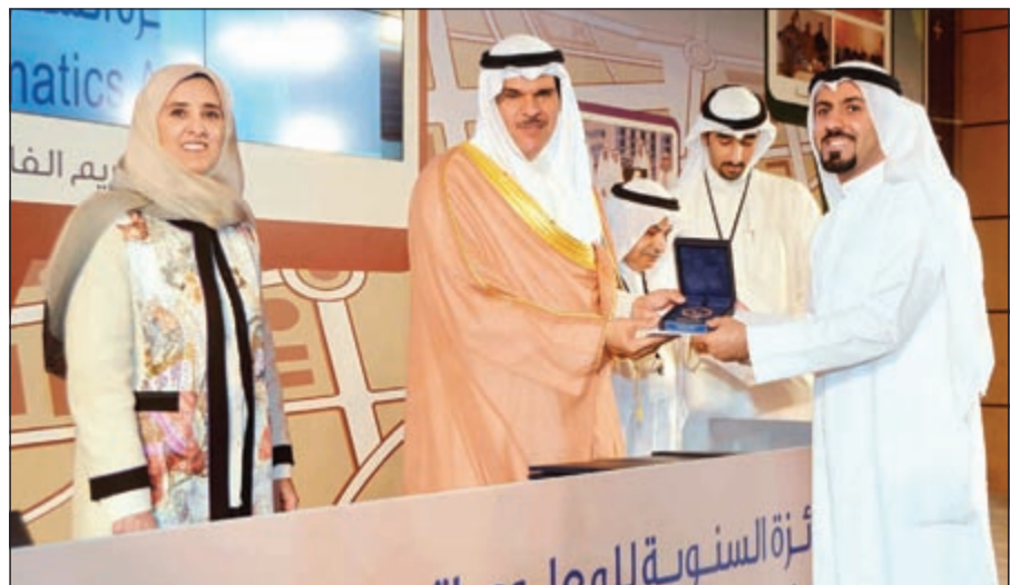
الشيخ سلمان الحمود مكرماً أحد المتطوعين بحضور الشيخة عايذة سالم