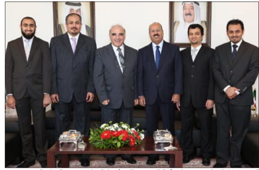
السفير فيصل المسيليم ووزير خارجية مالطا جورج فيلا مع أعضاء السفارة في مبنى السفارة الجديد

روما- كونا: افتتح وزير خارجية مالطا د. جورج فيلا وسفيرنا لدى مالطا فيصل المسيليم مبنى مقر سفارة الكويت الجديد في العاصمة فاليتا بحضور حشد من السفراء ورؤساء البعثات الدبلوماسية المعتمدين لدى مالطا. وجاء في بيان أصدرته سفارة الكويت في مالطا أمس أن وزير الخارجية المالطي أعرب في كلمة ألقاها في الحفل الذي أقيم بهذه المناسبة عن فخره واعتزازه الشديدين بالعلاقات القوية التي تربط جمهورية مالطا والكويت.