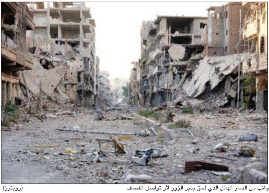
جانب من الدمار الهائل الذي لحق بدير الزور اثر تواصل القصف

واشنطن تبحث فرض حظر الجوي على سورية وموسكو تحذر إسرائيل من «نظام متطرف» يخلف الأسد!