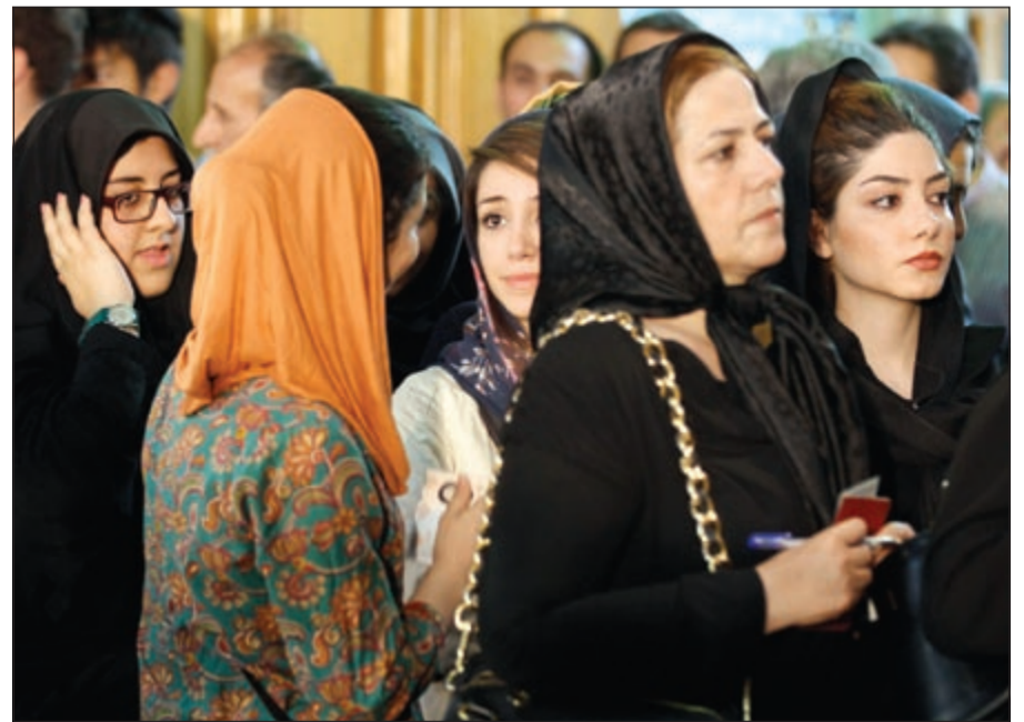
إيرانيات في انتظار الإدلاء بأصواتهن امس

الإيرانيون يختارون خلفا لنجاد والترجيحات تشير إلى دورة ثانية