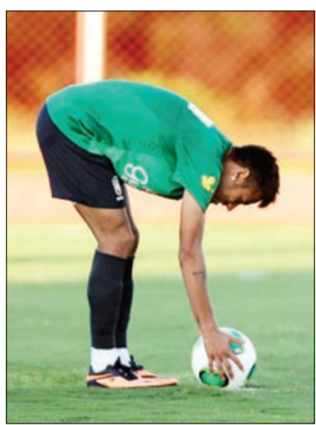
البرازيل على محك تنظيم كأس القارات التي تنطلق الليلة

بيروت: يوسف دياب حاول شخصان سوريان خطف مواطن كويتي اثناء خروجه من منزله في بحمدون الضيقة قرب الجامع الساعة الثامنة مساء اول من امس، وهناك دراسة حول إمكانية السماح بجمع التبرعات عبر وسيلة الكي نت في المساجد لكن لم يتخذ القرار بشأنها بعد.