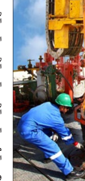
التعميم الجديد يعكس حيادية الشركة ومصادقتها في نظام الترقيات

وقال إن «نפט الكويت» التزمت بجميع التوصيات التي أصدرتها اللجنة التي شكلها وزير النفط السابق هاني حسين لبحث الترقيات التي تمت في الشركة والتي كانت برئاسة عبدالوهاب الوزان، مشيرا إلى أن لجان المفاضلة الداخلية عملت منذ أكثر من شهر ونصف الشهر على دراسة عمليات المفاضلة في الشركة وعملت على مدار أسبوعين على عمليات التقييم