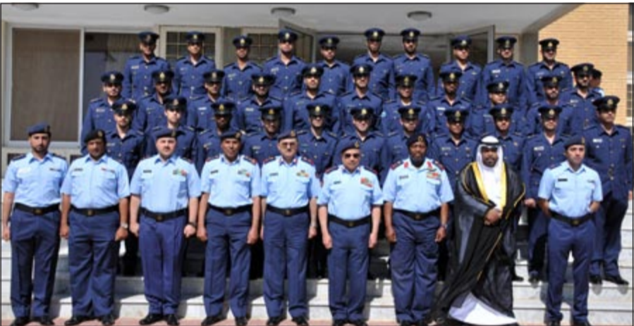
رئيس الأركان متوسطا الخريجين

العلمي المميز وتحقيقكم لهذه النتائج الطيبة». واعرب الفريق الركن خالد الجراح عن تهنئته لقيادة معهد القوة الجوية والمعلمين على الجهود القيمة والتي أثمرت ضباطاً متسلحين بالعلم في مجال تخصصهم مما يؤهلهم للنهوض والارتقاء بمستوى أداءهم في وحداتهم المختلفة. وأضاف «إننا في الجيش نفخر دائماً ونعتز بمشاركة الضباط من دول مجلس التعاون لدول الخليج العربية بمثل هذه الدورات التي تترك أثراً طيباً في النفوس وتعزز أواصر الاخوة والتعاون وتسهم في تبادل الخبرات بين الأشقاء» في إشارة الى وجود خريجين ضباط من مملكة البحرين الشقيقة في الدورتين. وشدد رئيس الأركان على ضرورة الاستفادة من المعلومات والتدريبات التي تلقوها أثناء الدورة في مجال تخصصاتهم المختلفة مما يسهم في رفع الجاهزية القتالية للجيش الكويتي. مطالباً الخريجين بأن يستمروا بالحماس والعمل والعطاء لخدمة هذا الوطن المعطاء.