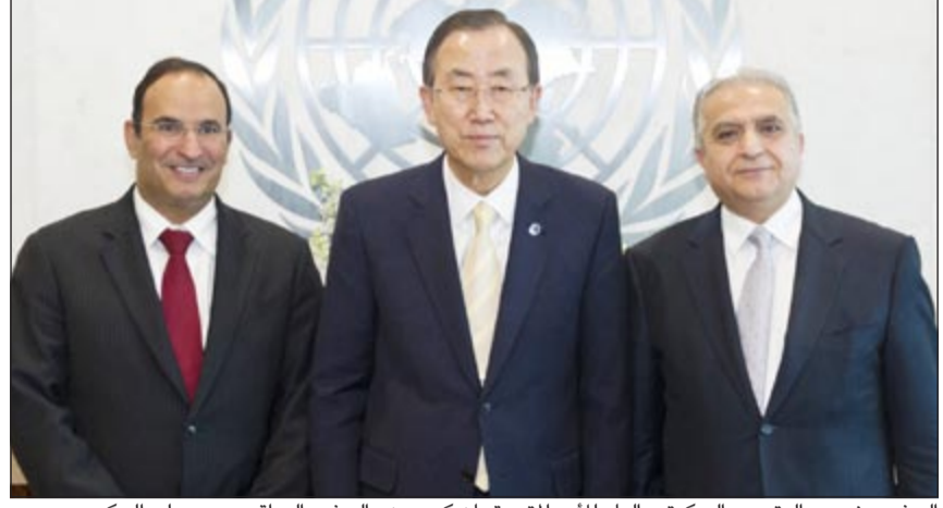
السفير منصور العتيبي والسفير العام للأمم المتحدة بان كي مون والسفير العراقي محمد علي الحكيم

الأمم المتحدة - كونا: ذكر مندوبنا الدائم لدى الأمم المتحدة السفير منصور العتيبي ان السكرتير العام للأمم المتحدة بان كي مون أجرى اتصالين بفيديواتي الكويت والعراق مساء أمس الأول أعرب فيهما عن سعادته وتنهائيه بالتطورات الحديثة التي جردت في العلاقات بين البلدين. جاء ذلك اثر اجتماع ضم السفير العتيبي ونظيره العراقي محمد علي الحكيم مع بان لتسليم مذكرة التفاهم التي وقعت عليها الحكومتان في 28 مايو لإنشاء لجنة ثنائية فنية تتولى ترتيبات عملية لصيانة العلامات الحدودية بين البلدين. وقال العتيبي في تصريح له «كونا» عقب الاجتماع «هذه اول مرة يلتقي فيها السكرتير العام بوفد كويتي - عراقي بشكل مشترك» مشيراً الى ان بان كي مون كان «سعيداً جداً».