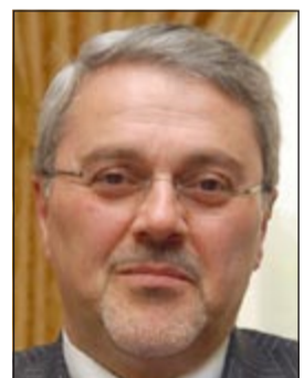
محمد حسين بحر العلوم

تحديد موعد لانعقاد اللجنة العليا المشتركة قريباً جداً وستشهد توقيع 6 اتفاقيات