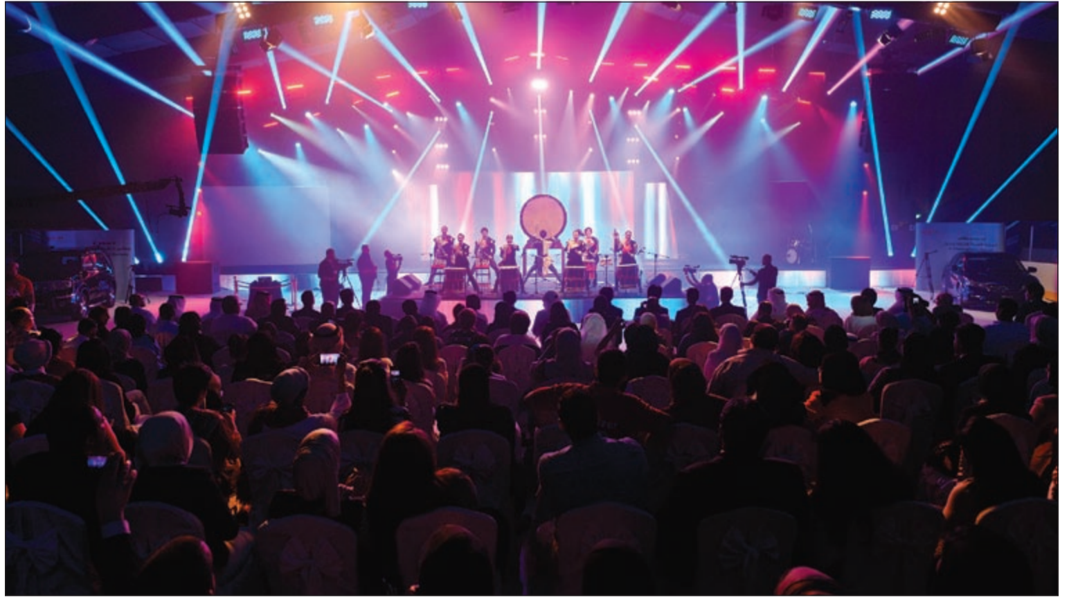
متابعة الحضور للحفل

وتلا المؤتمر الصحفي حفل موسيقي ضخم توج بمشاركة الفنان الإماراتي حسين الجسمي الذي سبقه عرض مميز جمع بين الحضارتين الكويتية واليابانية، كما ضم أحد أبرز الأحداث العلمية العالمية وغيرها من الفقرات التي جذبت انتباه الجمهور منذ اللحظة الأولى. وبدأت فعاليات هذه الأمسية بعرض حي ورائع شاركت فيه فرقة محلية قدمت العرضة الكويتية بطريقة رائعة وفي إيقاع تقليدي مبدع، بينما كانت فرقة تايكو اليابانية تثير إعجاب الحضور بهذه الموسيقى اليابانية الرائعة.