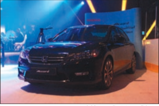
هوندا اكورد 2013 الجديدة كلياً

باتي إعلان هذه الشراكة بين هوندا موتور وبين صناعات الغانم بناء على التعاون بين الشركتين العملاقتين، مما جعل توقيع الاتفاقية يتم وفق إحساس واثق بأن النجاح سيكون حليف هذا الرابط الوثيق. وقامت صناعات الغانم بموجب هذا الاتفاق بتأسيس شركة الغانم موتور لتكون الوكيل الوحيد لكل منتجات هوندا في الكويت من سيارات ودراجات نارية ومعدات بحرية ومنتجات الطاقة بالإضافة إلى الكفالة وتقديم خدمة ما بعد البيع وقطع الغيار والزيوت الأصلية. وتمنح هذه الاتفاقية شركة الغانم موتور الحق في توزيع وخدمة سيارات هوندا بكل أنواعها ومنتجات ومعدات الطاقة من هوندا (كمولدات الكهرباء، وجزارات العشب ومعدات تقليب التربة والمضخات والمعدات البحرية)، إضافة إلى محركات القوارب والدراجات النارية بكل فئاتها. وستقوم صناعات الغانم بتوفير وإدارة المرافق الخاصة بمنتجات هوندا في الكويت، حيث يشمل ذلك مراكز صيانة متخصصة، مهندسي خدمة مؤهلين من هوندا، إضافة إلى مراكز بيع متخصصة وجديدة.