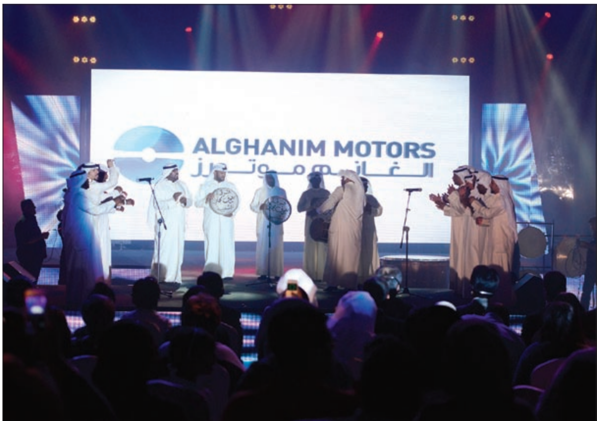
فرقة العيوف الفلكلورية تقدم العرضة الكويتية