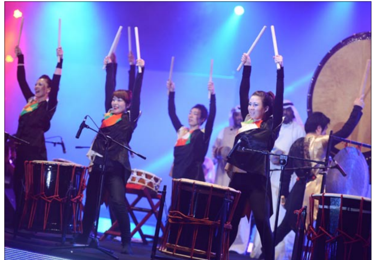
فرقة التايكو اليابانية وعرضها الإيقاعي