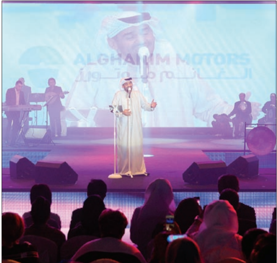
.. ويطرب الحضور بأغانيه

أسيمو أذهل الحضور خلال زيارته الأولى للكويت