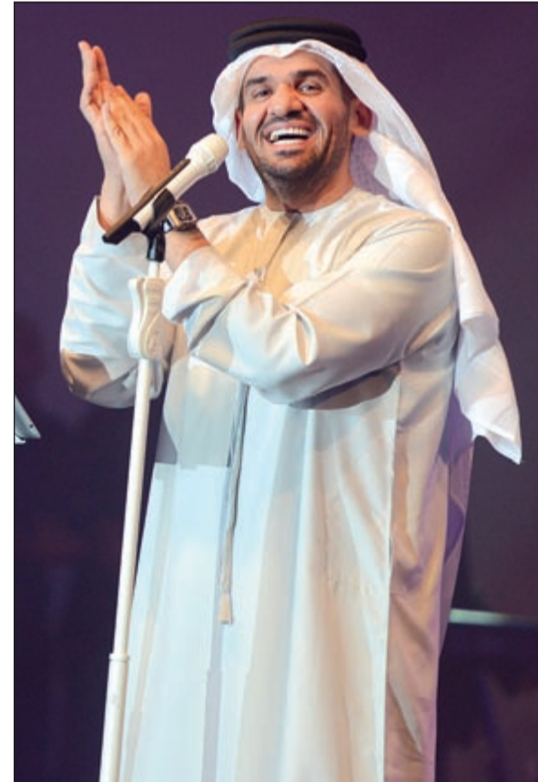
حسين الجسمي يتلألا على المسرح