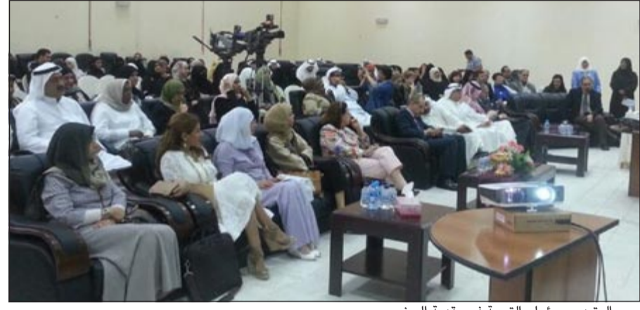
مريم الوتيد ومسؤولو التربية في مقدمة الحضور

التطوير في المناهج لن يكون في سنة أو 6 أشهر ولا حتى في سنتين، مبيّنا أن اختبارات تيمز وبيزل سوف تكون في العام 2015/2016 وكثير من الطلبة سوف يكونون متأثرين في المناهج القديمة، ولا أتوقع أن يكون التغيير جذريا خلال الـ 5 سنوات القادمة، ولكن ستكون هناك قفزة نوعية في جودة التعليم في الكويت. من جانبها، أعلنت وكيلة وزارة التربية مريم الوتيد وضع المسسات الأخيرة على معايير المناهج الابتدائية الجديدة وسوف يتم تسليمها جميعا إلى الموجهين العموم نهاية يونيو الجاري ليتسّم تحديث المناهج الدراسية وفق هذا التوجه. مبيّنة أن العام 2014/2015 سوف يشهد إدخال المناهج الجديدة إلى المرحلة الابتدائية وفق نقطتين أساسيتين الأولى إعداد معايير علمية تؤكّد المسجّدات العلمية في العلم ومعايير أخرى وطنية خاصة بالمجتمع الكويتي وفي كلا الأمرين الهدف واحد وهو تحويل الكويت إلى مركز تجاري واقتصادي متوقّعة حدوث طفرة نوعية في مستوى التعليم والمخرجات التعليمية في البلاد. وأشارت الوتيد إلى أن هذا العمل سوف يصاحبه برنامج تدريبي للمعلمين والموجهين وكل أصحاب