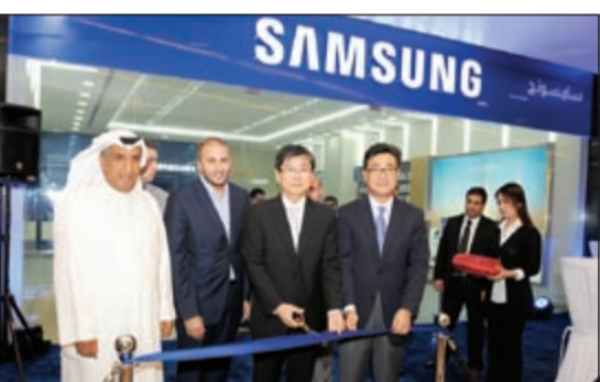
جانب من قص شريط الافتتاح

لكل عشاق التسوق في الكويت. ويأتي افتتاح هذه الصالة وفقاً لخطة الهادفة إلى دعم التزامنا بتوفير الأفضل لسوق الكويت وتعزيز علاقاتنا مع عملائنا. ويتميز المعرض عن غيره بحداثة التصميم والديكور الداخلي بما يتناسب مع فخامة علامة سامسونج التجارية، ويعتبر من المعارض المتميزة لبيع منتجات سامسونج المحمولة في الكويت، حيث يشتمل على أحدث الهواتف النقالة وأجهزة الكمبيوتر اللوحية والكاميرات الرقمية. كما خصصت شركة هران طاقماً من الموظفين المختصين في الإلكترونيات والمدربين على أفضل الطرق لخدمة العملاء وإعطاء كل المعلومات والخدمات اللازمة للعملاء.