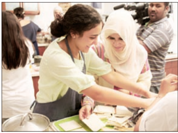
لقطة من المشاركين في البرنامج