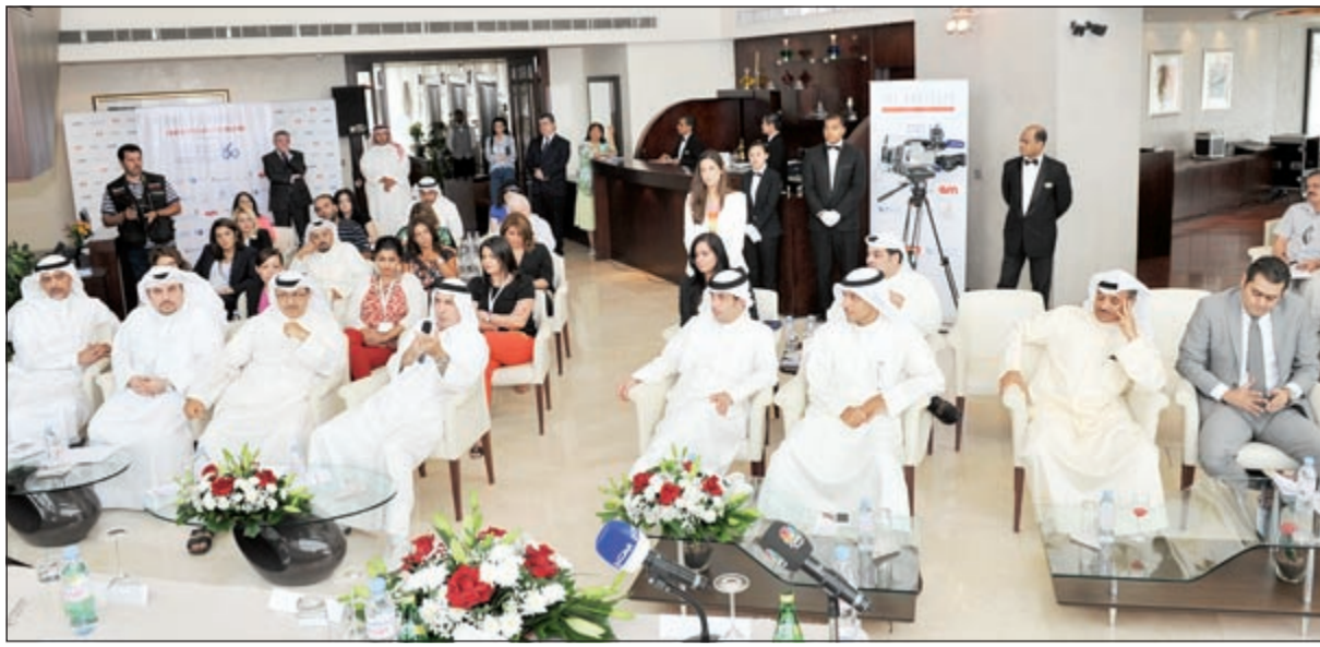
جانب من حضور قيادات كيبكو وبرقان والمشاركين في برنامج بروتوجيز خلال المؤتمر الصحفي