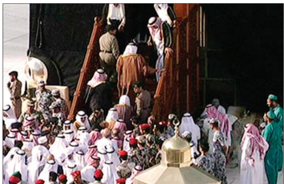
عدد كبير من الدبلوماسيين شاركوا في غسل الكعبة

الى عدد من المسؤولين السعوديين. يذكر ان غسل الكعبة سنة نبوية فعلها الرسول ﷺ يوم فتح مكة تطهيرا لها من أي رجس. وتتم عملية غسل الكعبة المشرفة مرتين كل عام الأولى في شهر شعبان والثانية في شهر المحرم وتغسل بماء زمزم مضافا إليه ماء الورد.