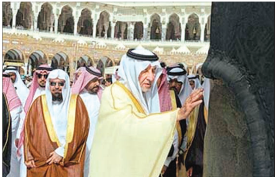
الأمير خالد الفيصل خلال غسل الكعبة