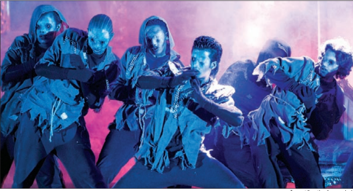
الجاميع ورقصاتهم التعبيرية