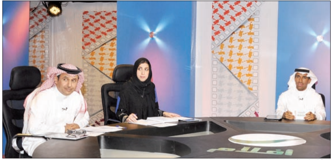
لجنة التحكيم أثناء مناقشتهم للأفلام