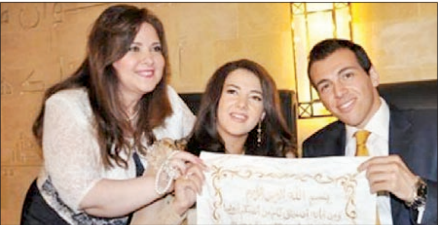
دنيا ورامي في حفل عقد القران

القاهرة: في أحد مساجد التجمع الخامس تم عقد قران الفنانة دنيا سمير غانم على الشيخ خالد الجندي بصفته مأذونا وحضر الحفل عائلتا العروسين وبعض من اصدقاء العمل والوسط الفني والإعلامي وتالقت والدة دنيا سمير غانم، يذكر ان حفل الزفاف سوف يتم الخميس المقبل في القاهرة حيث انه كانت قد تمت خطبة العروسين في مايو من العام السابق في حفل اقتصر حضوره على الأقارب والأصدقاء المقربين فقط الامر الذي كان مفاجأة لمحبي ومعجبي الفنانة دنيا سمير غانم، حيث انه لم تكن هناك مقدمات أو مؤشرات تشير إلى وجود فانس الاحلام رامي رضوان لمن لا يعرف الإعلامي رامي رضوان هو مذيع على قناة اون تي في ويقدم برنامج صباح اون.