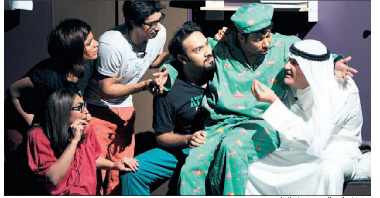
من المشاهدة الجميلة في «وحيد في المنزل»