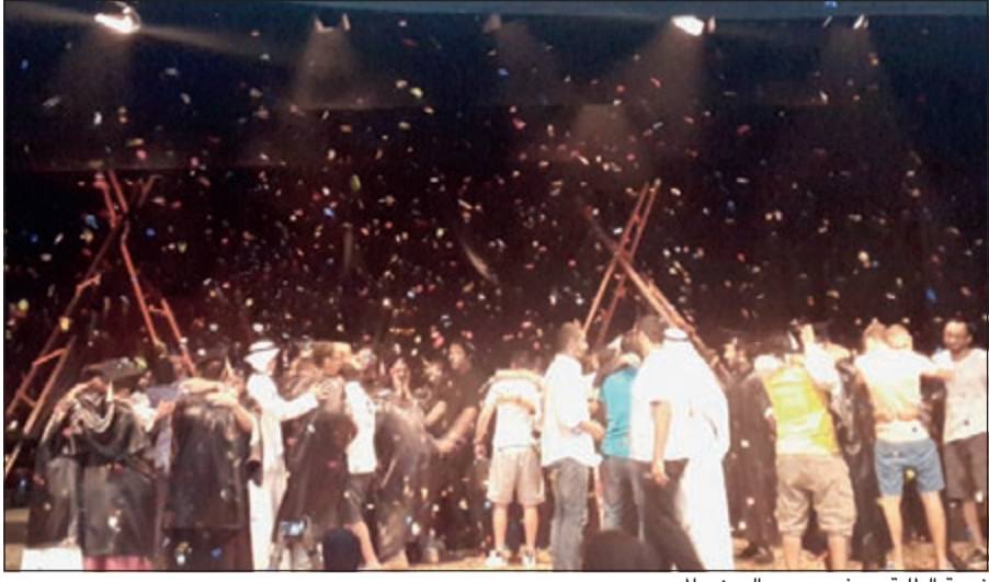
فرقة الطلبة مع ذويهم بعد العرض المسرحي