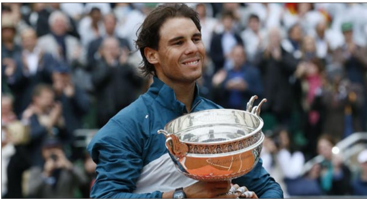
الإسباني رافايل نادال يحمل كأس البطولة

المركز الأول لقب زوجي الرجال في البطولة بفوزهما على الفرنسيين ميكائيل لودرا ونيكو ماهو 6-4 و6-7 و6-7 (4-7) في المباراة النهائية.