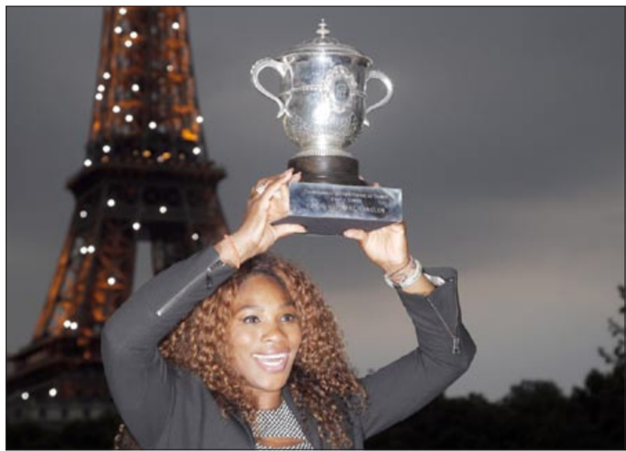
بطلة لقب فردي السيدات سيرينا وليامز تحمل الكأس أمام برج إيفل