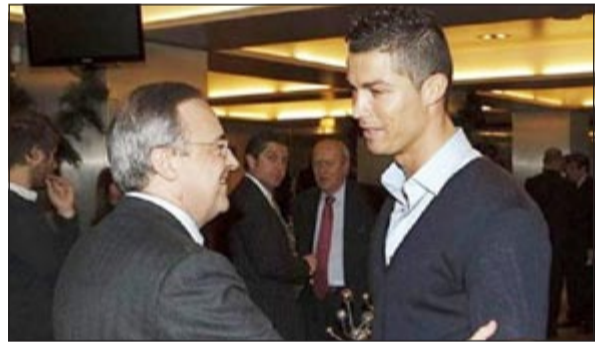
نجم ريال مدريد رونالدو مع رئيس النادي الملكي بيريز

شبهه رئيس نادي ريال مدريد الإسباني فلورنتينو بيريز نجم الفريق البرتغالي كريستيانو رونالدو دي ستيفانو وزين الدين زيدان. وقال بيريز في مقابلة مع صحيفة «ماركا» الإسبانية نشرت مقتطفات منها على موقعها الإلكتروني، «نود أن يكون رونالدو حجر الزاوية في مشروعتنا». وتابع «الفرق دائما ما تلتف حول لاعب كبير في عصره، التف الفريق حول رونالدو، وبعد ذلك حول زيدان. الآن المنطقي أن يلتف حول كريستيانو، لا يوجد أفضل من الالتفاف حول اللاعب الأفضل في العالم». وأضاف بيريز «اهتمامي أنا وكريستيانو والجمهور هو أن يلعب البرتغالي هنا لسنوات عديدة، وعندما يرغب الجميع في أمر من الصعب