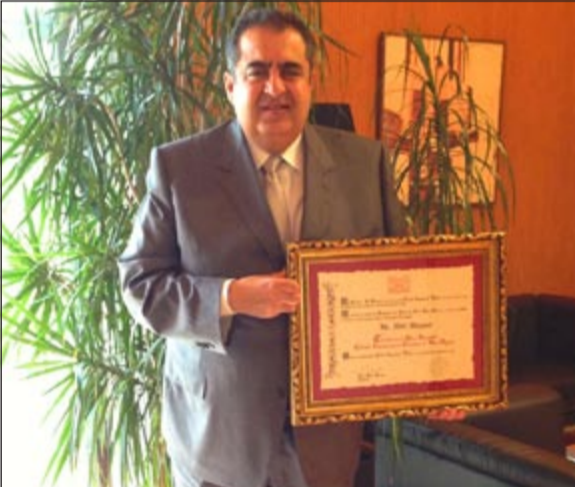
السير عادل العيار بعد أن منح لقب «فارس» من قبل المؤسسة العالمية (ثيسار إيكيدو سرائو) الخاصة بنشر السلام حول العالم

الأقل نموا والفقيرة من خلال الصندوق الكويتي للتنمية الاقتصادية.