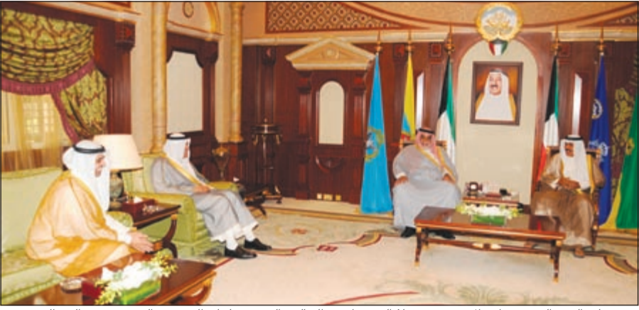
سمو ولي العهد الشيخ نواف الاحمد مستقبلا الشيخ احمد الخالد والشيخ سلمان الحمود والشيخ محمد عبدالله