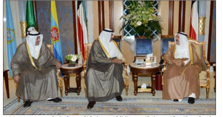
صاحب السمو الامير الشيخ صباح الاحمد مستقبلا صباح الخالد وعبد الوهاب البدر