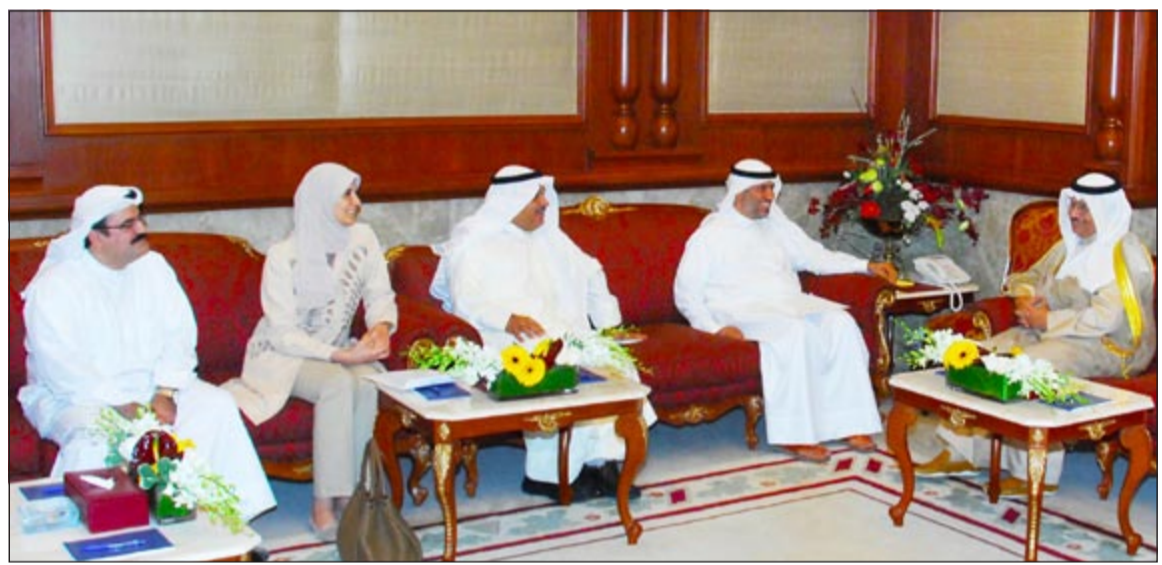
سمو رئيس الوزراء الشيخ جابر المبارك مستقبلا رئيس وأعضاء جمعية الشفافية

الاجراءات الحكومية وحمايتها من الفساد اداريا وقانونيا، مشيرا الى ان كل الخطوات الاصلاحية المتخذة والمطروحة تحد من المخاطر والاحباط في نفوس الموظفين والمسؤولين على حد سواء.